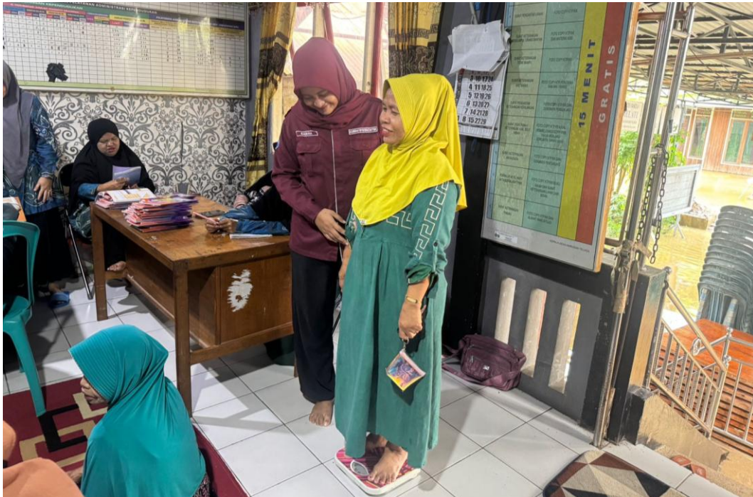
*Dokumentasi Kegiatan Posyandu Lansia Di Desa Harusan Telaga