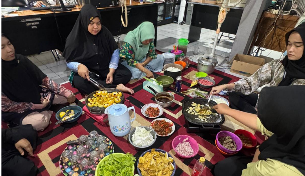
*Dokumentasi Perpisanan Pendamping Desa Harusan Telaga Sekaligus Makan Bersama