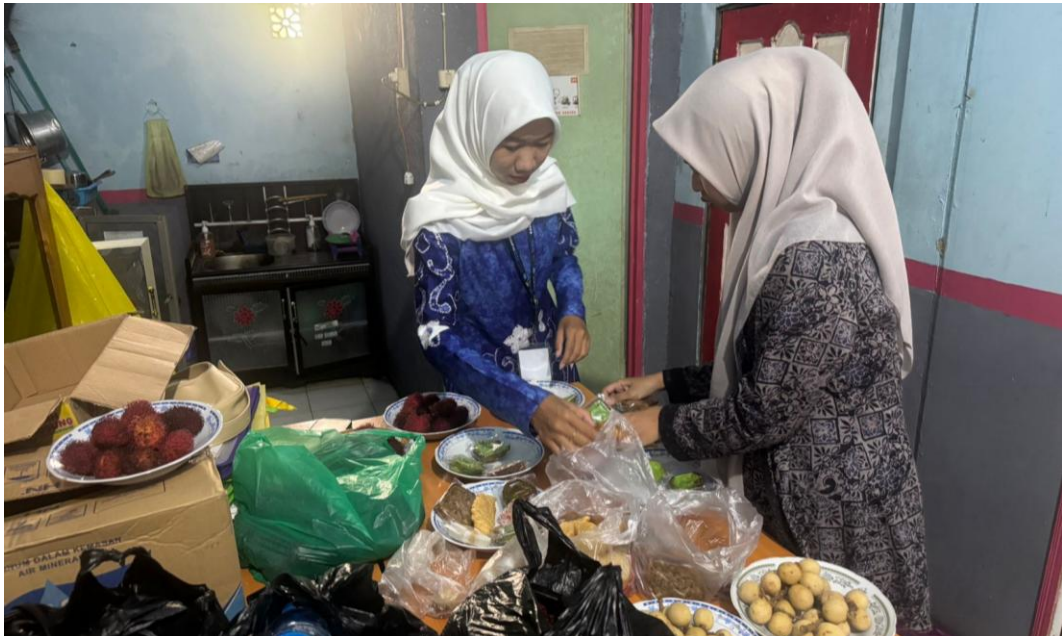
*Dokumentasi Menyiapkan Konsumsi Untuk ACARA Kecamatan Yang DILAKSANAKAN DI Kantor Desa Harusan Telaga