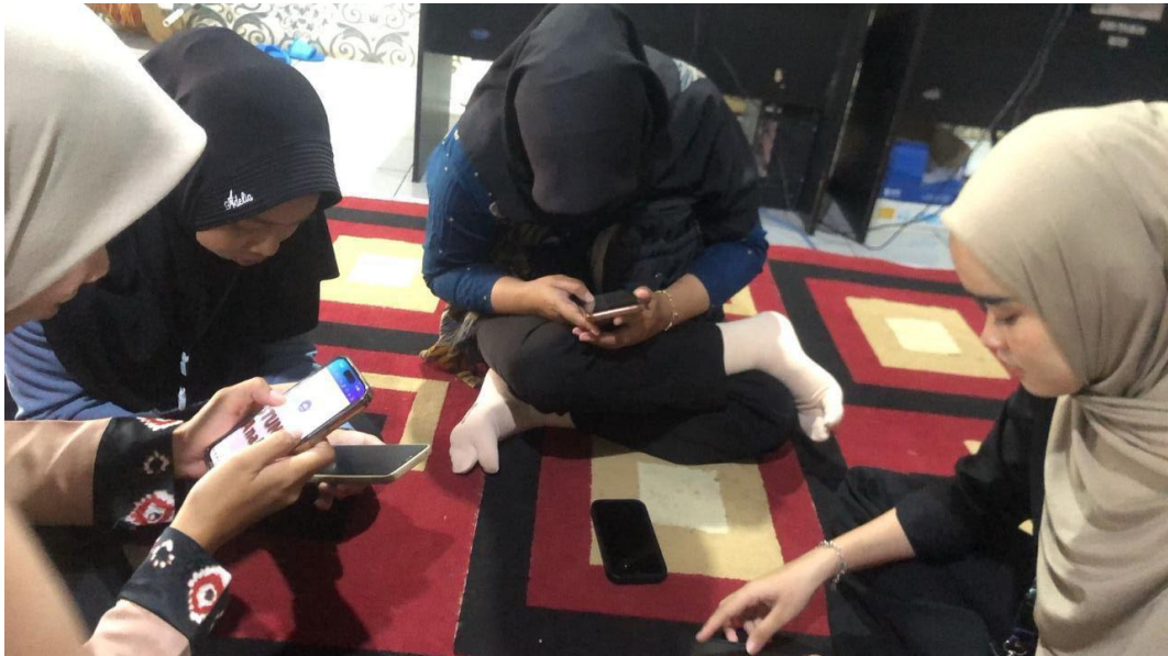
*Dokumentasi Proses Desain Undangan dan Spanduk untuk Sosialisasi BINA Stunting