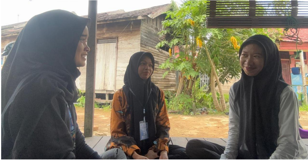
*Dokumentasi Rapat Koordinasi Program Kerja KKN tentang BINA Stunting (Bimbing Ibu, Nutrisi Anak tanpa Stunting)