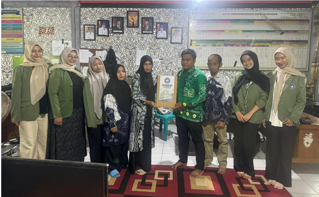
*Dokumentasi Penjemputan Mahasiswa KKN Sekaligus Penyerahan Kenang-Kenangan Kepada Pemerintah Desa Harusian Telaga