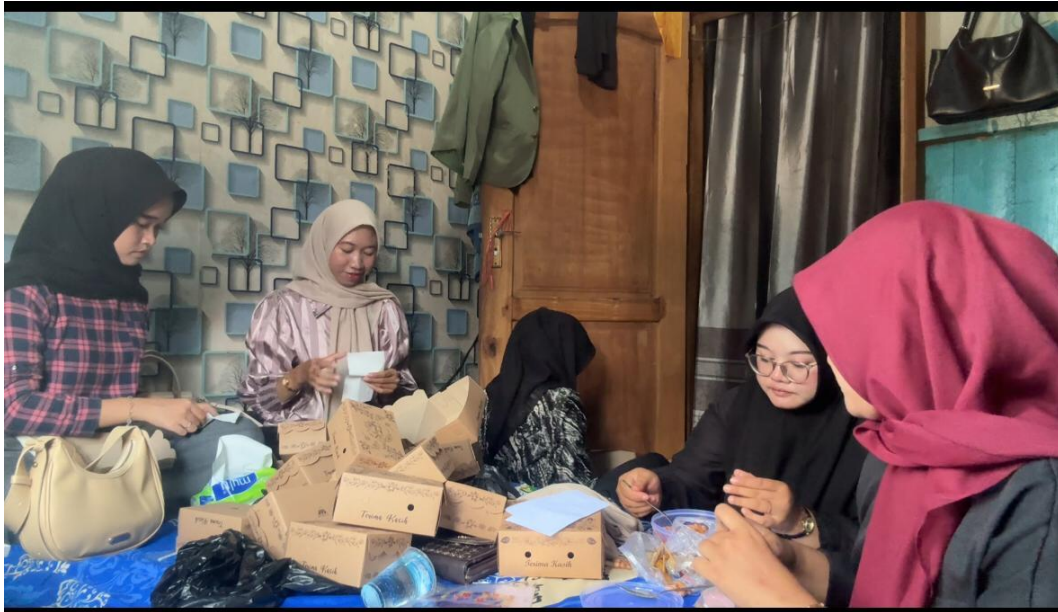
*Dokumentasi Persiapan Pelaksanaan Program Sosialisasi Bina Stunting