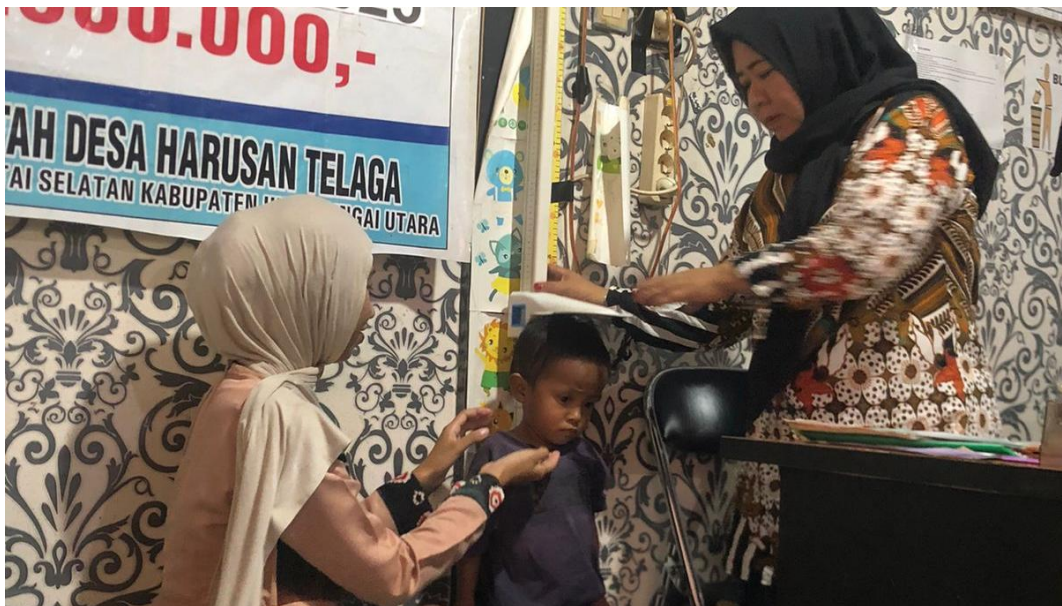
*Dokumentasi Kegiatan Posyandu Balita Di Desa Harusan Telaga