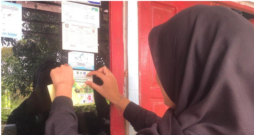
*Dokumentasi Penempelan Stiker Edukasi Mengenai Cara Pemilahan Sampah Organik, Anorganik dan Residu