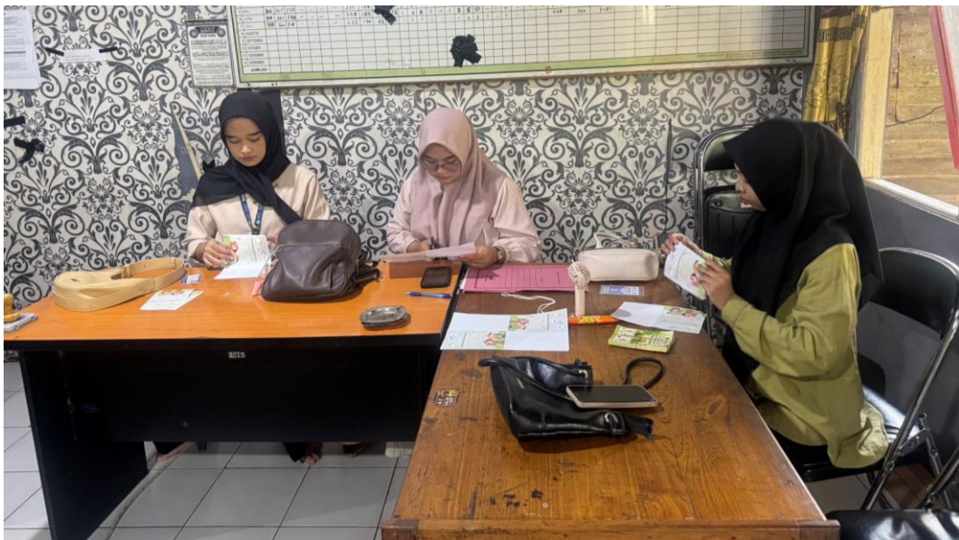
*Dokumentasi Pencetakan dan Pemotongan undangan sosialisasi bina Stunting