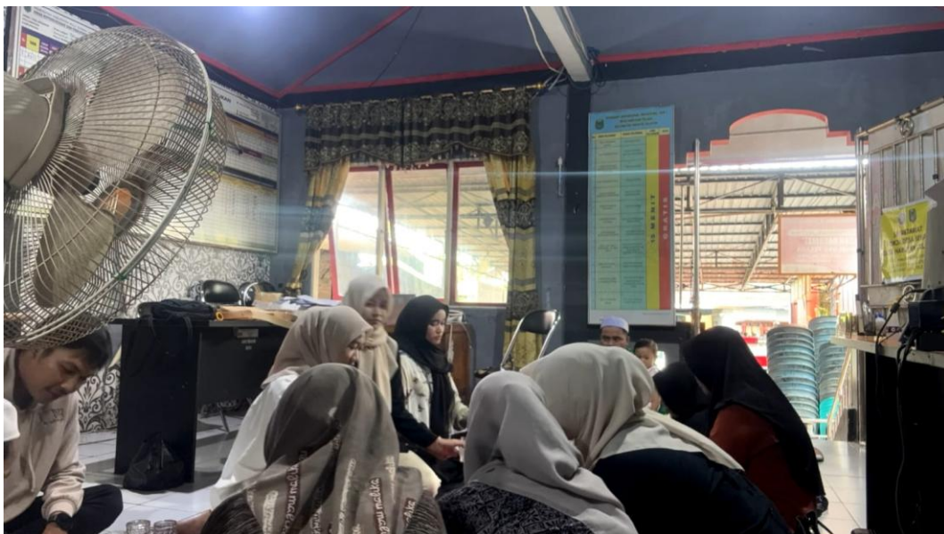
*Dokumentasi Makan Bersama dalam Rangka Perpisahan Mahasiswa KKN dengan Pemerintah Desa Harusian Telaga