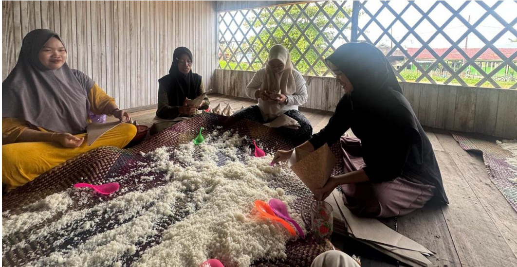
*Dokumentasi Membantu Di Rest Area Desa Harusan Telaga Dalam Rangka Haul Guru Danau Ke-2