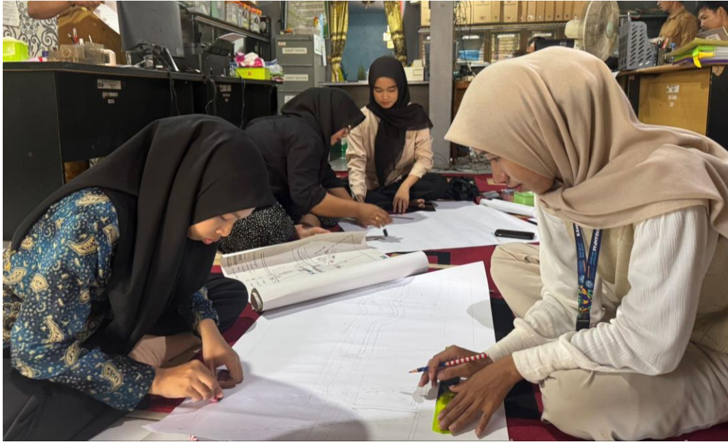
*Dokumentasi Pembuatan Peta Desa, Peta Sasaran Wus Dan Peta Sasaran Pus