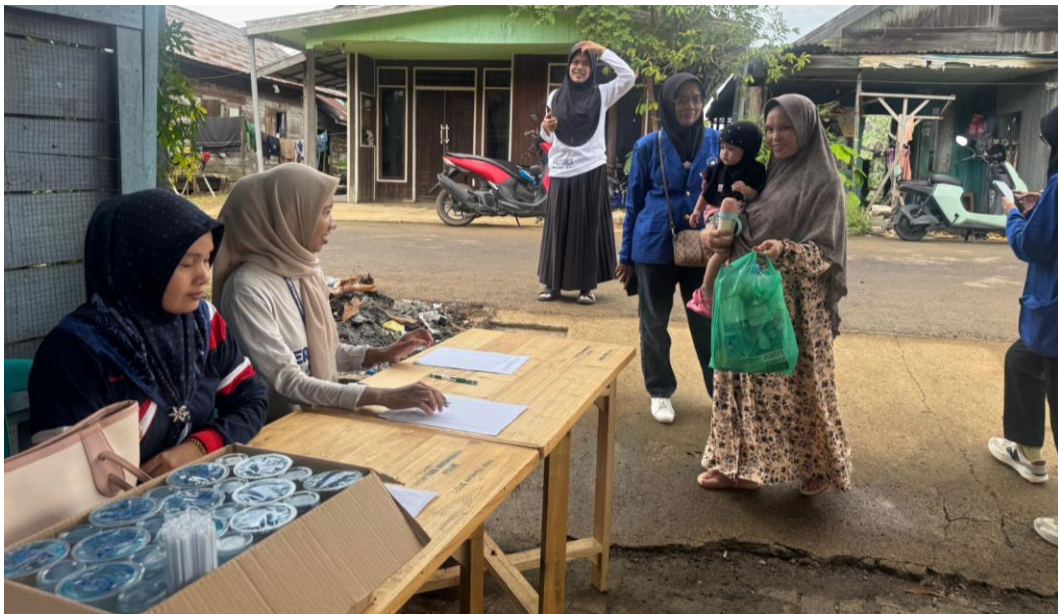
*Dokumentasi Proses Penukaran Sampah Pada Program Kerja Sampah Berkah