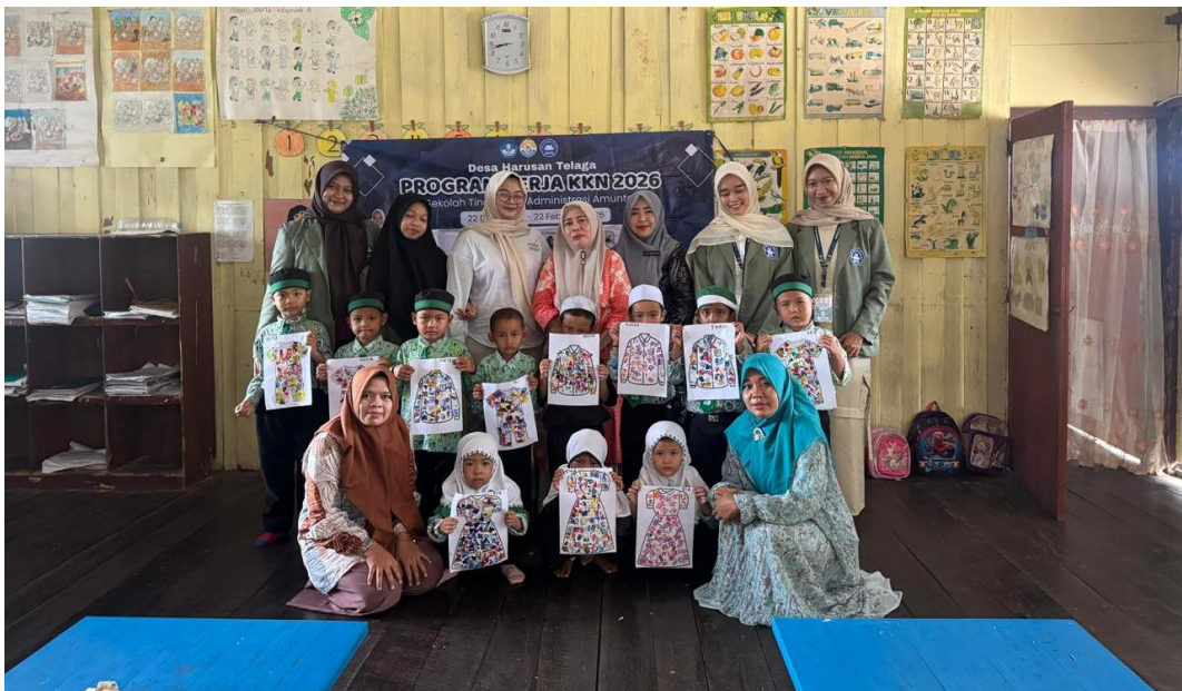
*Dokumentasi Hasil Karya Kolase Dari Murid TK RA SULLAMUN NAJAH Di desa Harusan Telaga