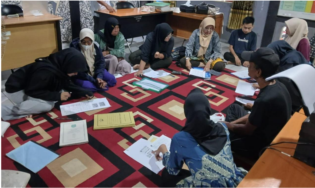
*Dokumentasi Membantu Pengisian Berkas Persyaratan Bedah Rumah pada Masyarakat Desa Harusan Telaga