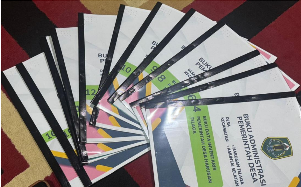
*Dokumentasi Hasil Buku Administrasi yang dibuat oleh Mahasiswa KKN