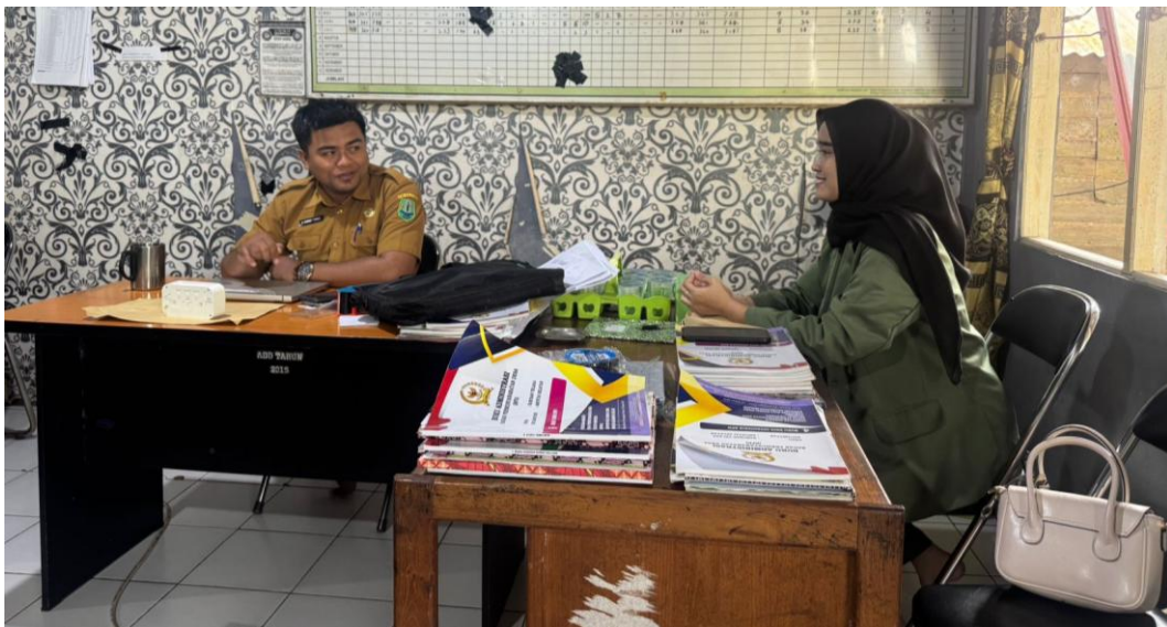
*Dokumentasi Kesediaan Kepala Desa Harusan Telaga menjadi Instruktur Desa Bagi Mahasiswa KKN