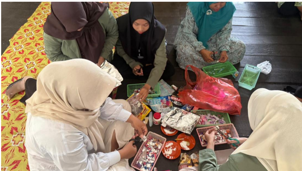
*Dokumentasi Persiapan Pelaksanaan Program Kerja SELIMUT (Seni Dari Limbah) Di TK RA SULLAMUN NAJAH Di Desa Harusan Telaga PELAKSANAAN PROGRAM KERJA SELIMUT (SENI DARI LIMBAH) PADA TK RA SULLAMUN NAJAH DI DESA HARUSAN TELAGA