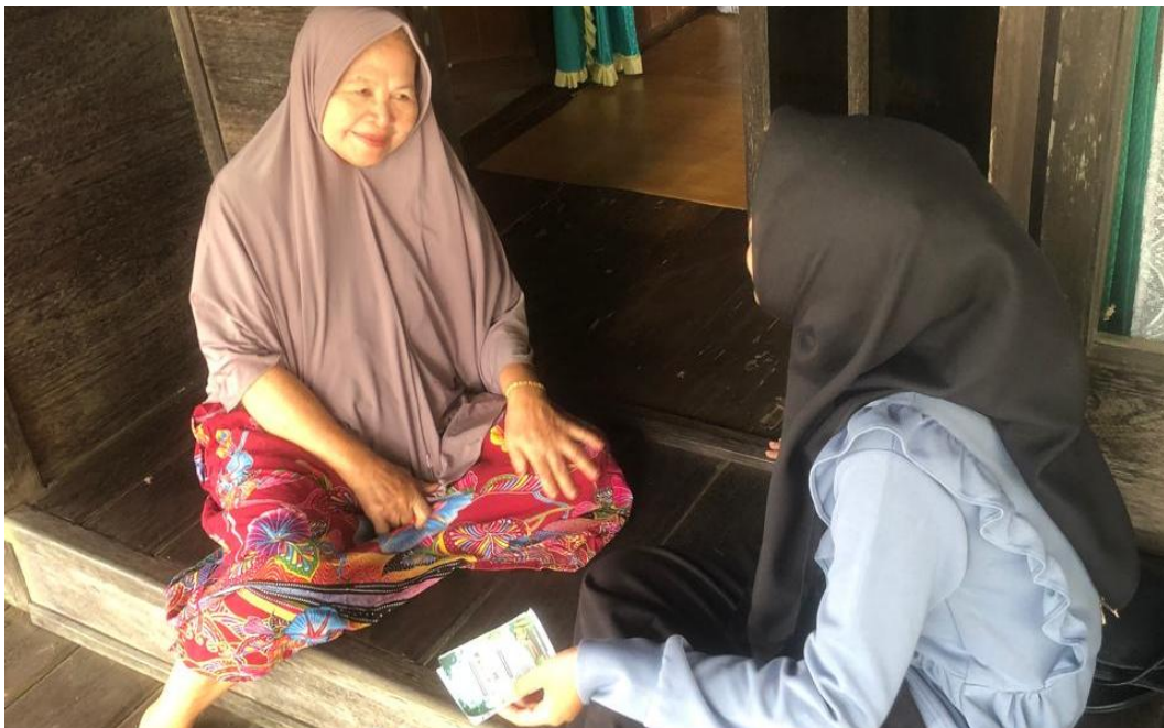
*Dokumentasi PENYEBARAN Undangan Sosialisasi Bina Stunting Kepada Masyarakat Desa Harusan Telaga