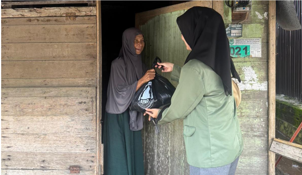
*Dokumentasi Pembagian Sembako Kepada Masyarakat Desa Harusan Telaga Yang Terdampak Banjir