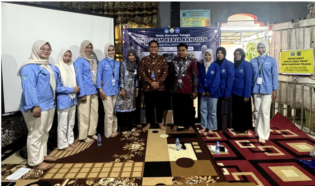
*Dokumentasi Pelaksanaan Program Kerja Bina Stunting