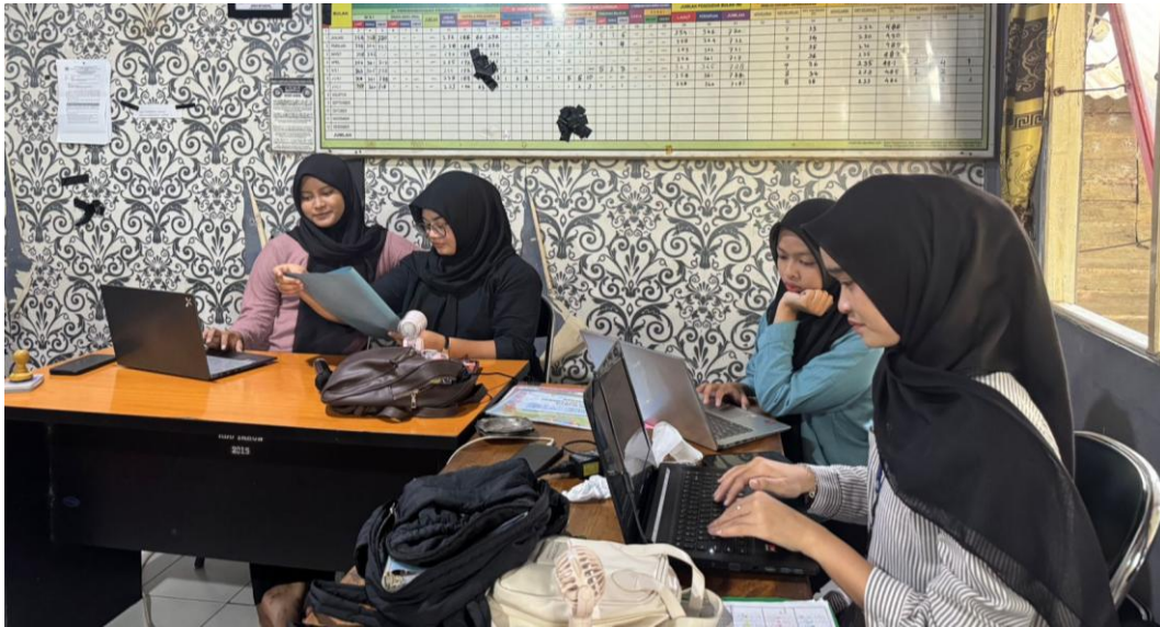
*Dokumentasi Pembuatan Register Desa Harusan Telaga