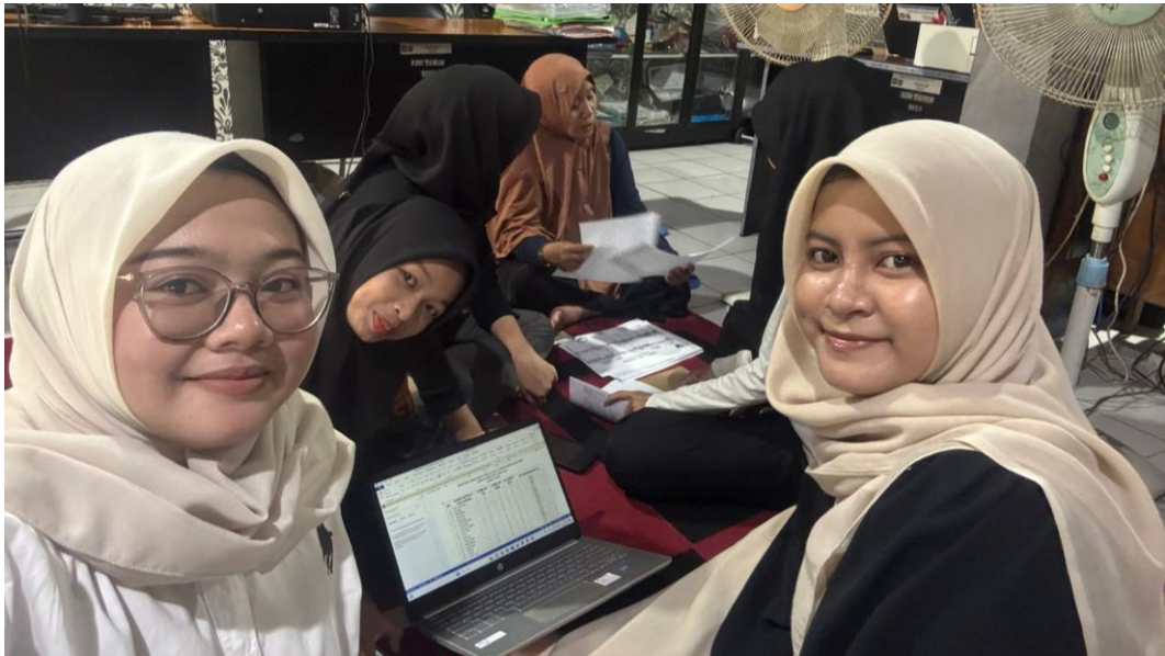
*Dokumentasi Penyusunan Proposal Permohonan Bantuan Bencana Banjir Bagi Masyarakat Desa Harusan Telaga