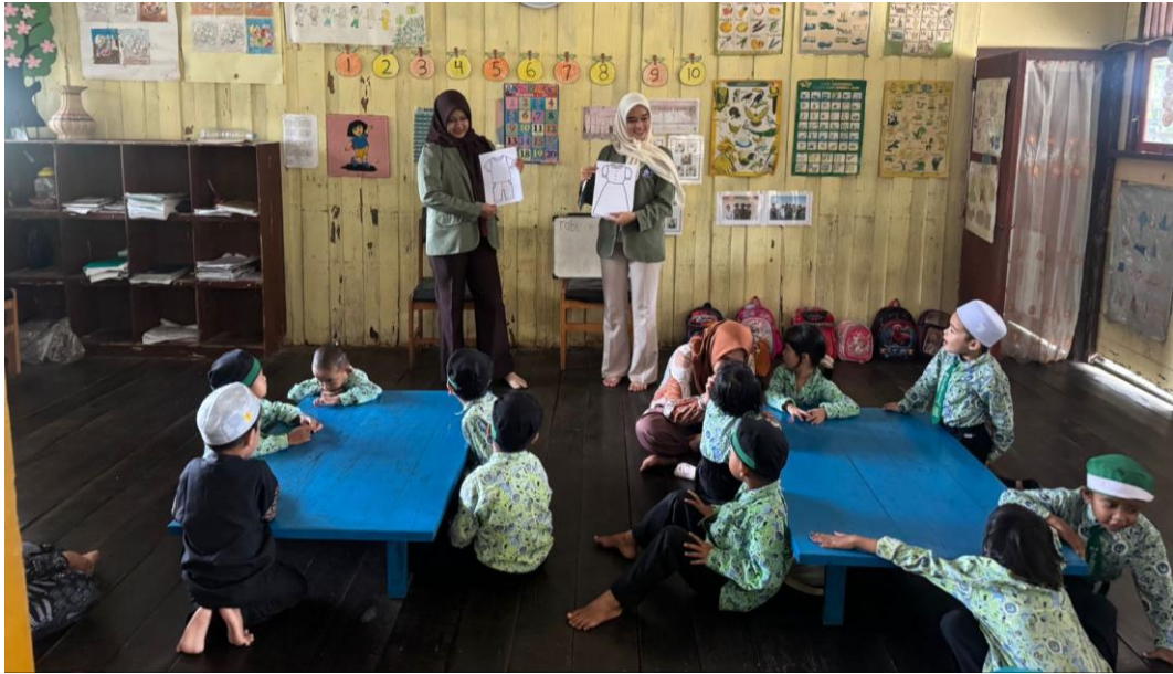
*Dokumentasi Pelaksanaan Program Kerja SELIMUT (Seni Dari Limbah) Pada TK RA SULLAMUN NAJAH Di Desa Harusan Telaga