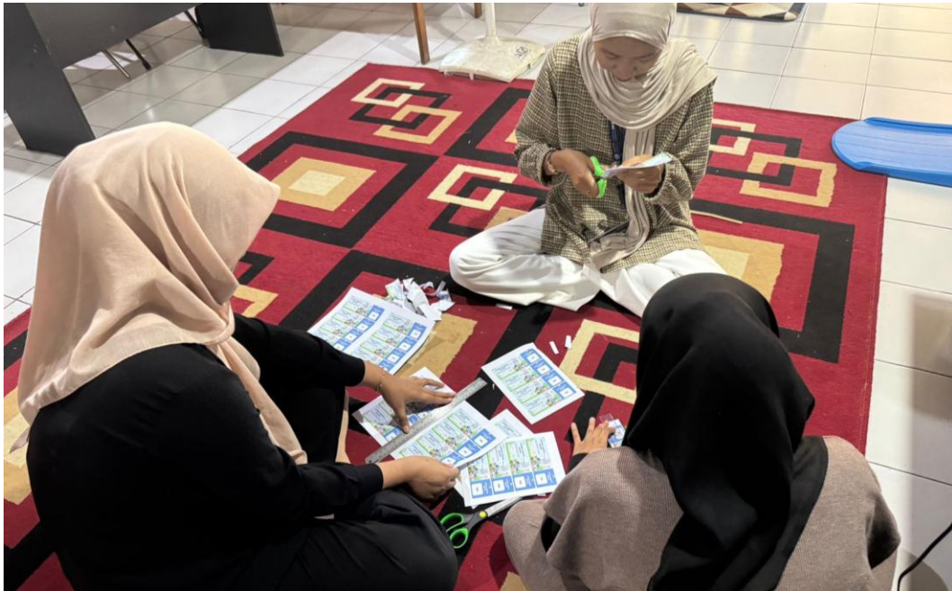
*Dokumentasi Pembuatan Kupon Undian Untuk Program Kerja BESTI (Bugar Bersama Bakti Mahasiswa)