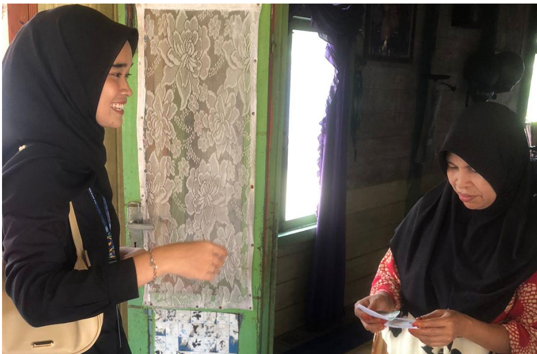
*Dokumentasi Membagikan Undangan Senam Dan Sampah Berkah Kepada Masyarakat Desa Harusan Telaga