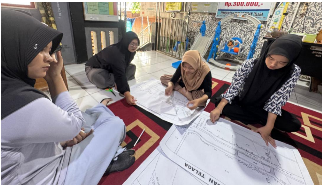
*Dokumentasi Finishing Pembuatan Peta Desa, Peta Sasaran Wus dan Peta Sasaran Pus dengan Pemberian Keterangan Warna