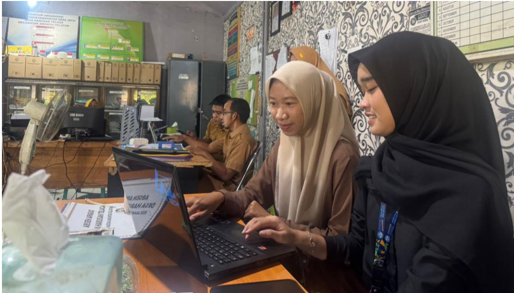
*Dokumentasi Membuatkan Format Proposal Desa Harusan Telaga