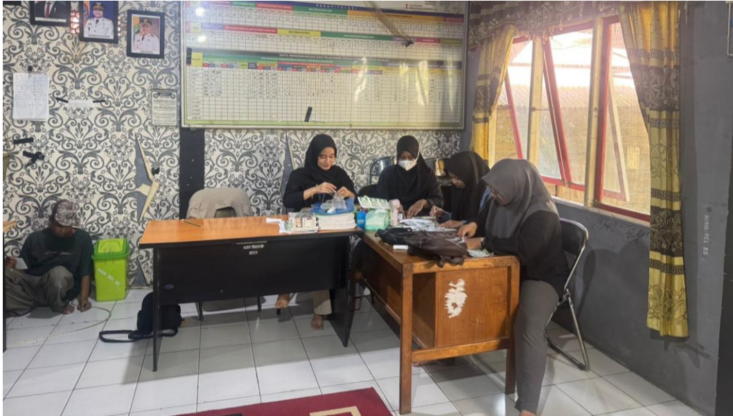
*Dokumentasi Persiapan Pelaksanaan Program Kerja Senam dan Sampah Berkah