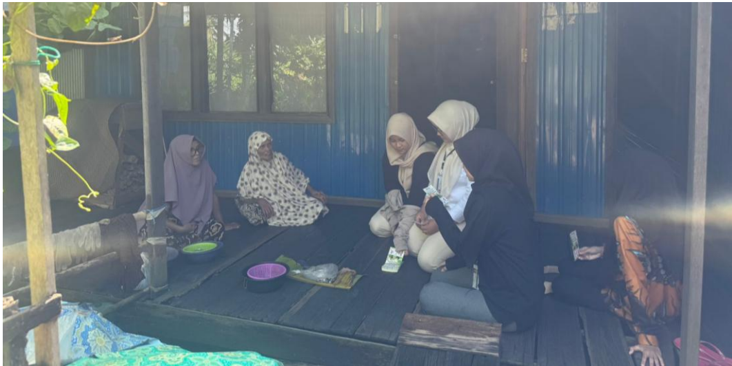
*Dokumentasi Sosialisasi Mengenai Cara Pemilahan Sampah Organik, Anorganik dan Residu Kepada Masyarakat Desa Harusan Telaga