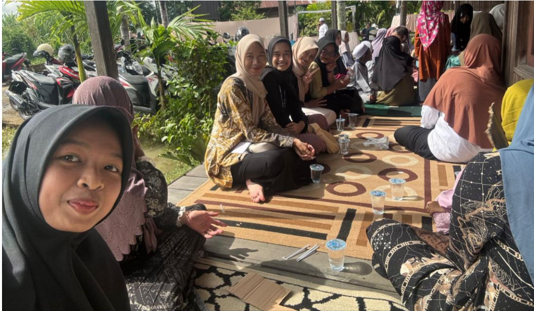
*Dokumentasi Menghadiri Acara Tasmiah Masyarakat Desa Harusan Telaga