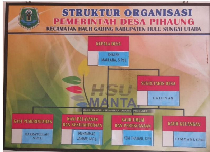
Gambar 3.1 Struktur Organisasi Kantor Desa Pihaung