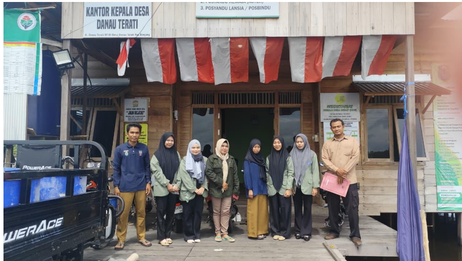
Pengantaran Mahasiswa KKN Oleh Dosen Pembimbing Lapangan Serta Pengenalan Lingkungan Tempat KKN Oleh Kepala Desa dan Aparat Desa Danau Terati