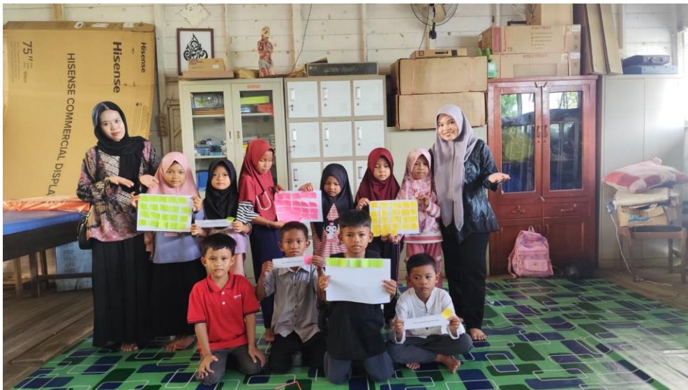
Les Membaca Kelas 1& 2 Permainan Mencari Abjad