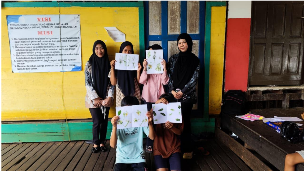
Pelajaran Seni Budaya Membuat Eco Printing Pada Kelas 6