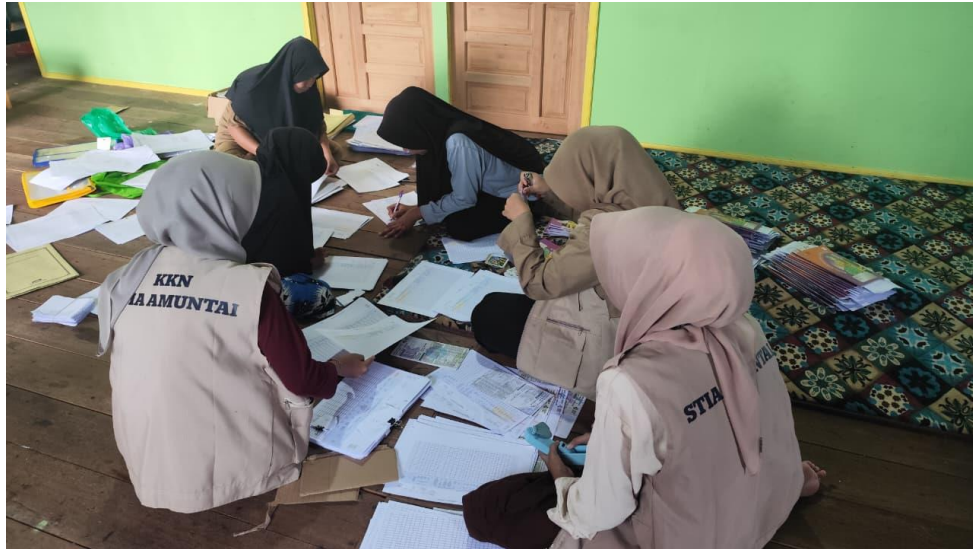
Ikut Membantu Pencatatan Administrasi Posyandu Desa Danau Terati