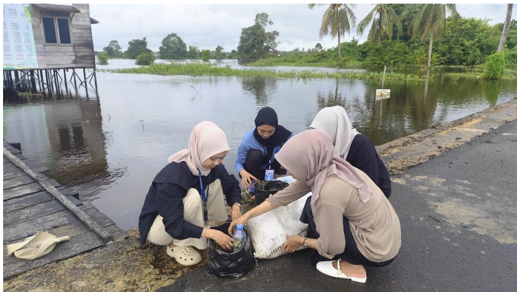
Pembuatan Popok Kompos Biopori Desa Danau Terati