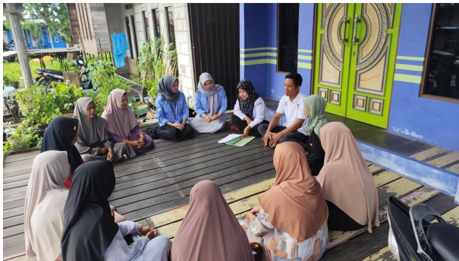
Membantu Sosialisasi Dinas Perikanan Pada Desa Danau Terati