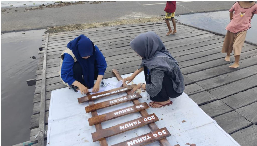
Pembuatan Papan Edukasi Tentang Sampah Desa Danau Terati