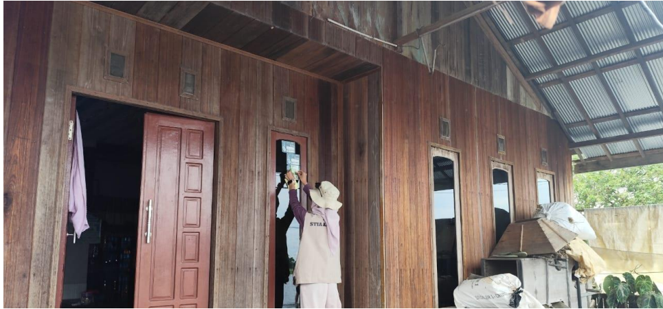
Pemasangan Stiker Edukasi Tentang Stunting dan Pengolahan Kompos Desa Danau Terati