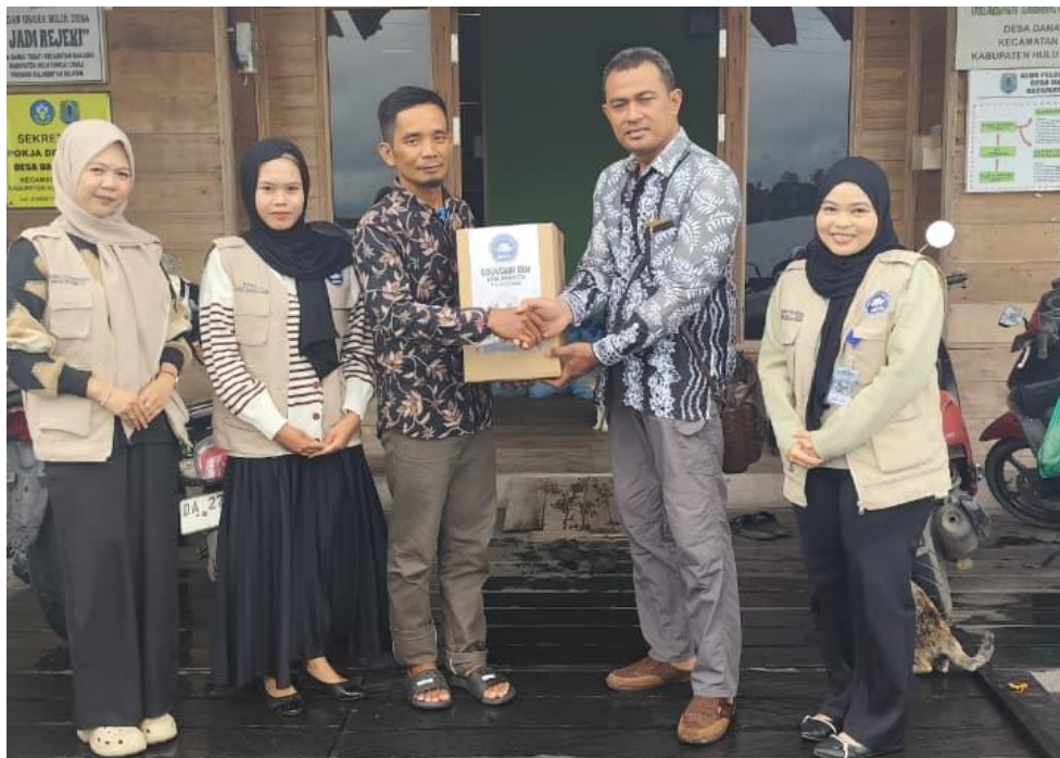
Penjemputan Mahasiswa KKN Oleh Dosen Pembimbing Lapangan (DPL)