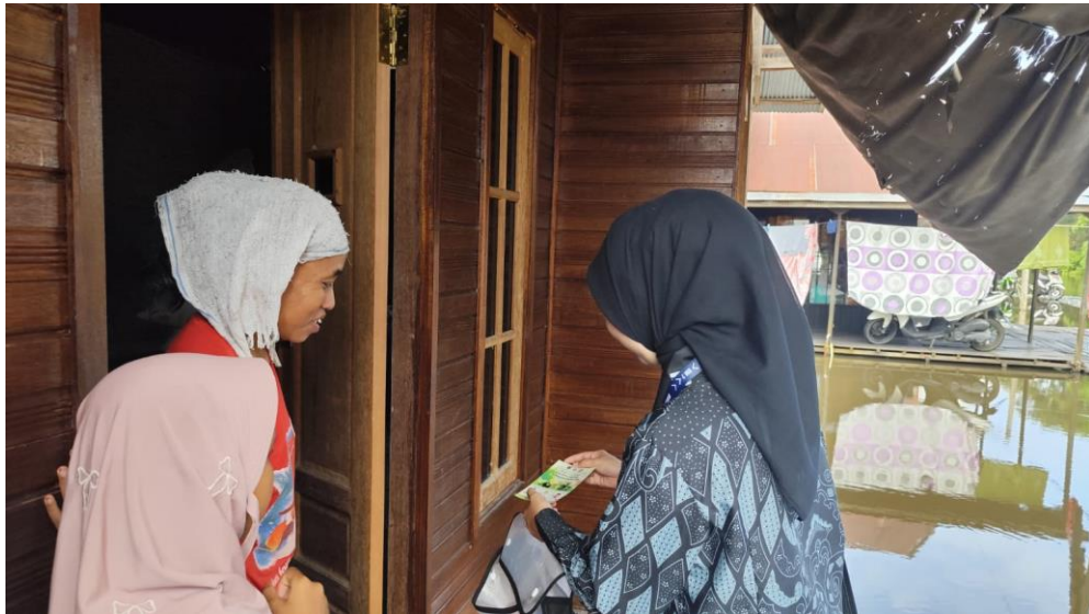
Penyampaian Edukasi Tentang Stiker Pengolahan Sampah Desa Danau Terati