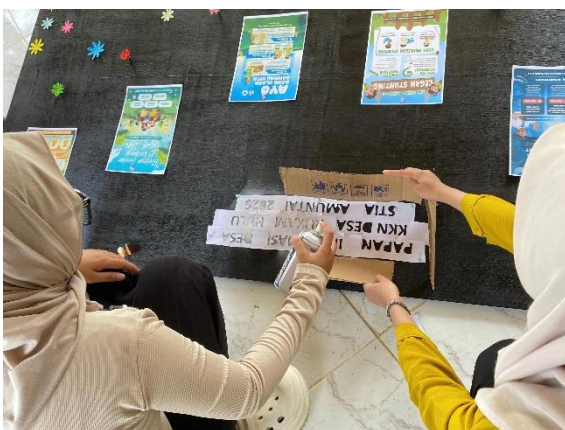
Pembuatan Papan Mading Desa