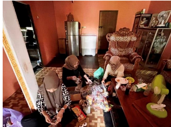
Pengemasan Konsumsi Peserta Sosialisasi