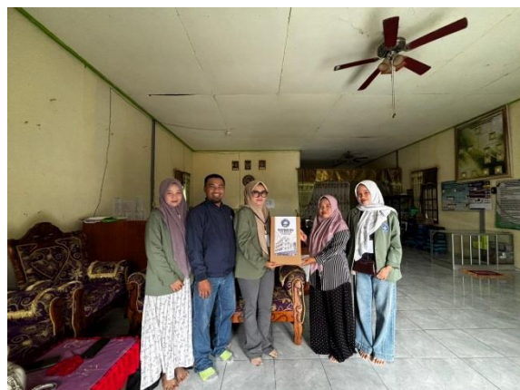
Penjemputan Mahasiswa KKN