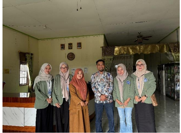
Pengantaran Mahasiswa KKN