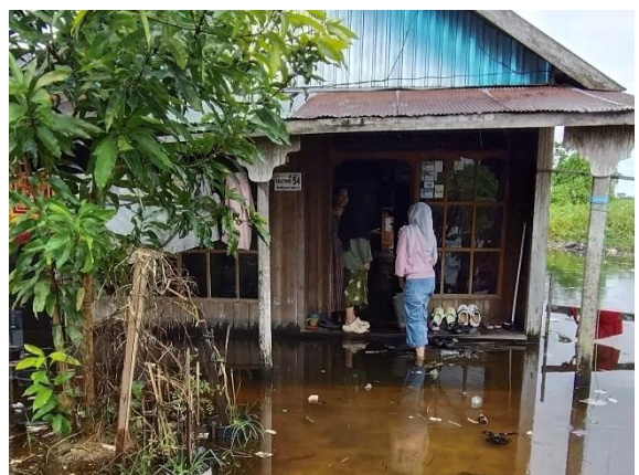
Pendataan Rumah Terdampak Banjir