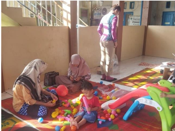
Pendampingan Posyandu Balita