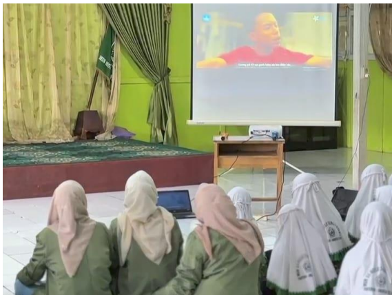
Sosialisasi Bullying di MIN 15 HSU