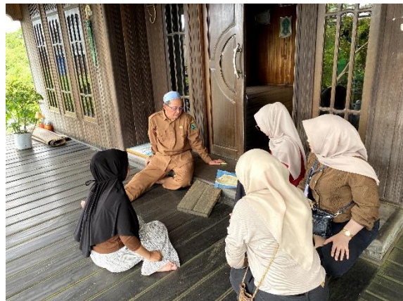
Koordinasi dengan Kepala Desa