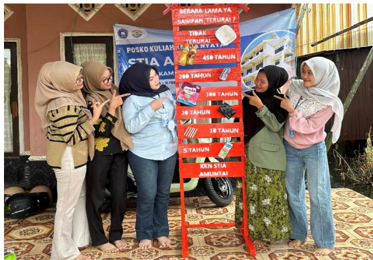
Gambar 4. 1 Pengelolaan Sampah Berbasis Masyarakat

Hasil dari kegiatan ini menunjukkan adanya peningkatan terkait pengelolaan sampah di lingkungan desa. Warga menunjukkan antusiasme terhadap stiker yang ditempel di rumah mereka, dan beberapa warga mulai menerapkan pemilahan sampah sederhana. Surat kerja sama yang telah ditandatangani juga menjadi landasan hukum pelaksanaan program pengelolaan sampah yang diharapkan dapat terus berjalan setelah KKN selesai.