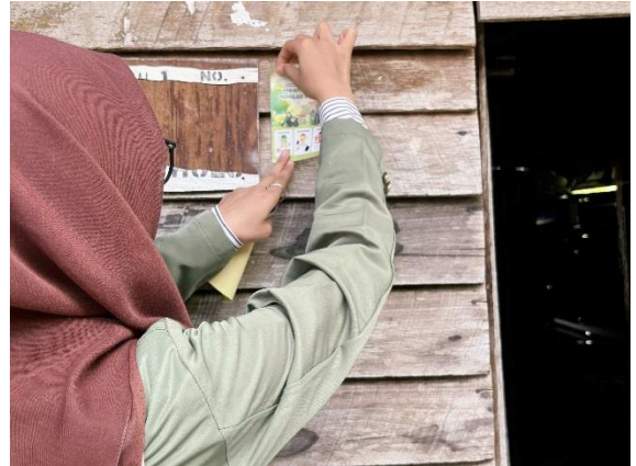
Penempelan Stiker Sampah pada Rumah