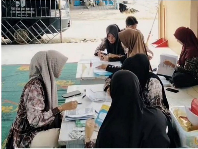
Gambar 4. 2 Sosialisasi Pencegahan Stunting