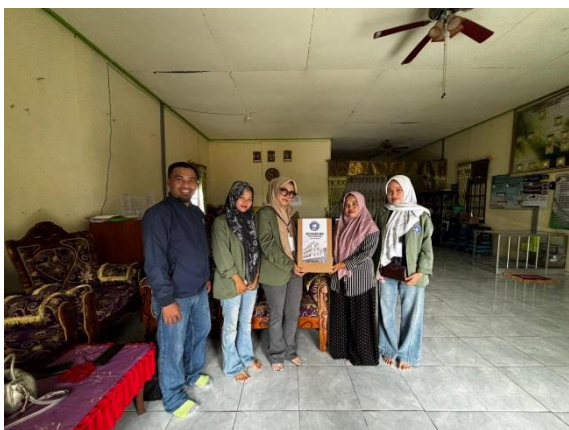
Penjemputan Mahasiswa KKN