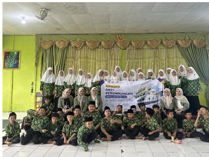
Gambar 4. 4 Sosialisasi Anti Bullying di MIN 15 HSU

Hasil kegiatan menunjukkan peningkatan kesadaran yang nyata di kalangan siswa MIN 15 HSU. Anak-anak mulai memahami bahwa bullying bukanlah hal sepele, melainkan perilaku yang merugikan semua pihak. Mereka juga memperoleh pengetahuan tentang cara menolak dan melaporkan tindakan bullying kepada guru atau orang tua. Selain itu, terjalinnya hubungan baik antara tim KKN dan warga sekolah membuka peluang kolaborasi lanjutan dalam menciptakan lingkungan sekolah yang aman dan kondusif.