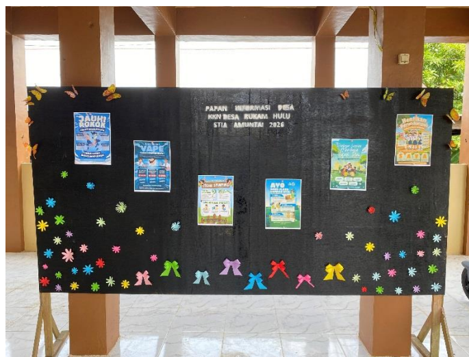
Gambar 4. 3 Pembuatan Majalah Dinding (Mading) Desa

Hasil yang diperoleh menunjukkan respons positif dari masyarakat desa. Anak-anak yang sering bermain di sekitar kantor desa terlihat antusias berhenti untuk membaca dan menunjuk gambar-gambar yang menarik perhatian mereka. Perangkat desa juga menyampaikan apresiasi dan menilai mading ini lebih bermanfaat karena tidak hanya berfungsi sebagai tempat pengumuman, tetapi juga sebagai sarana edukasi yang ramah dan menarik bagi semua kalangan.