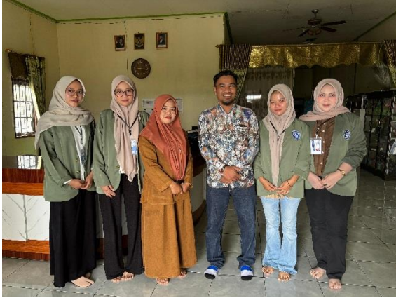
Pengantaran Mahasiswa KKN