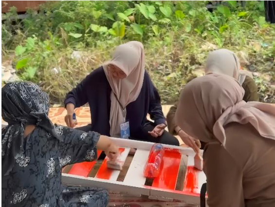
Plang Edukasi Sampah