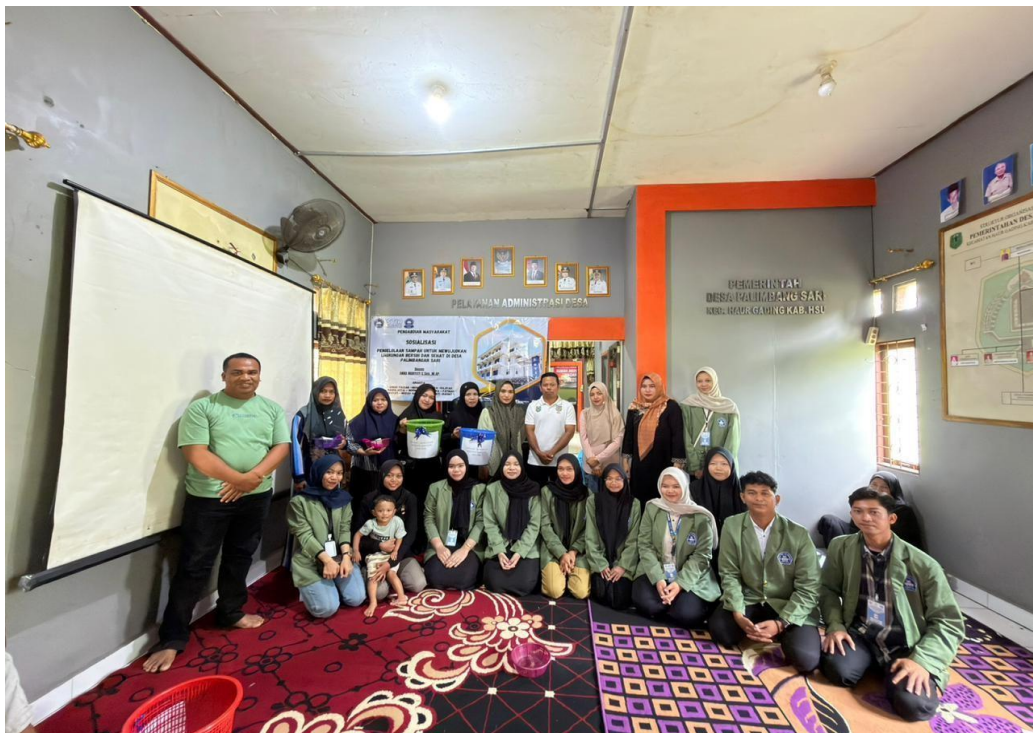
Gambar 11 Pengmas Sosialisasi tema pengelolaan sampah di desa Palimbang Sari