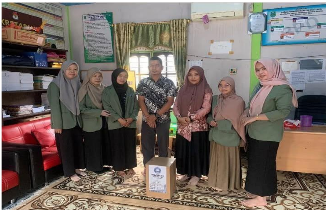
Gambar 12 Penjemputan Mahasiswa KKN Oleh DPL