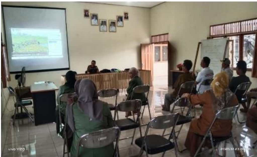
Gambar 2 Kegiatan Sosialisasi di Kantor BPP