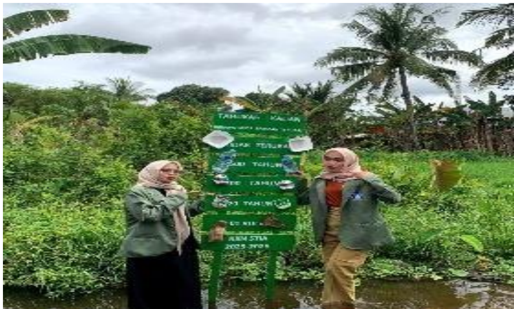
Gambar 4 Pembuatan Plang Sampah