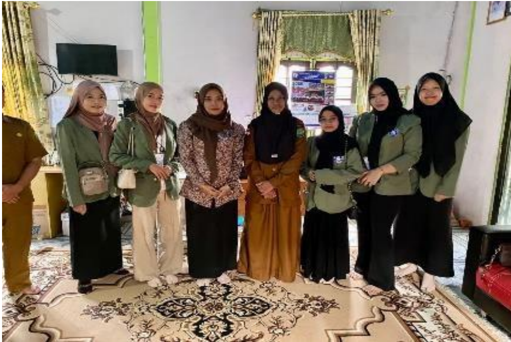
Gambar 1 Pengantaran Mahasiswa KKN Oleh DPL