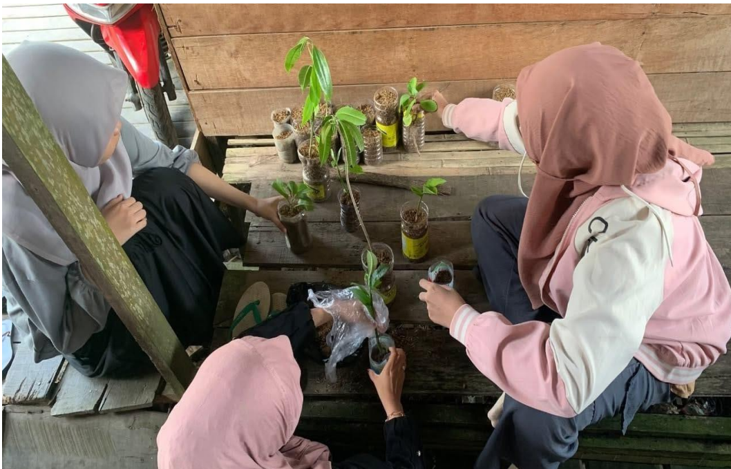
Gambar 9 Pemanfaatan botol bekas menjadi pot tanaman