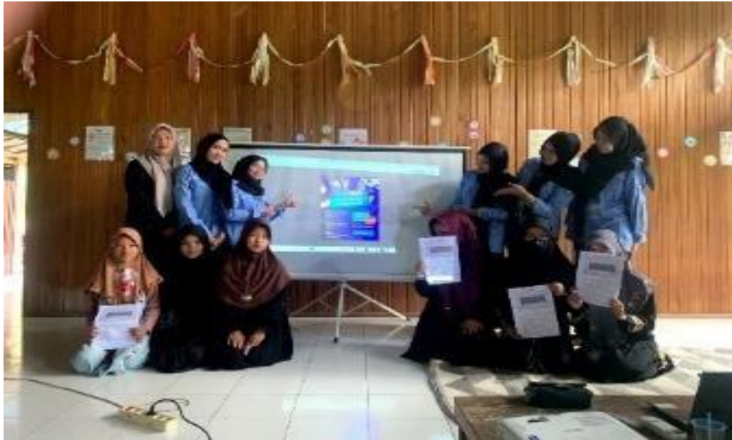
Gambar 3 Pelatihan Komputer Bina Gen-Z