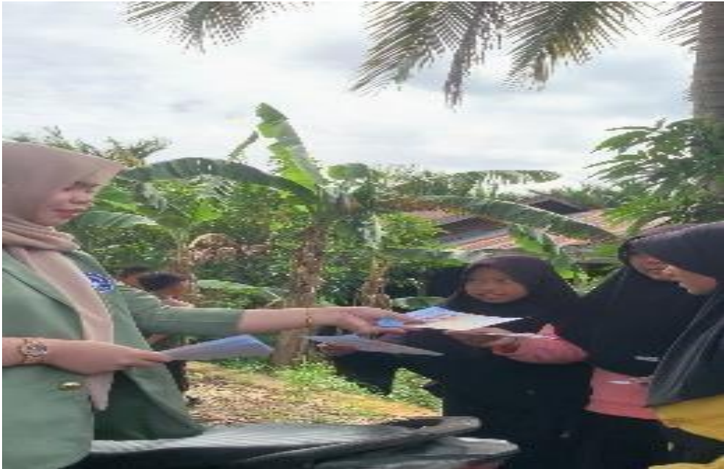
Gambar 10 Poster Edukasi sampah dan stanting