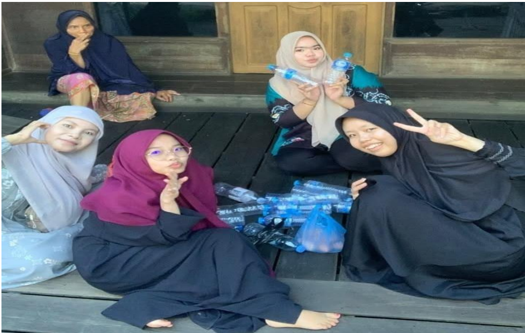
Gambar 8 Barter botol bekas dan bungkus deterjen dengan telur