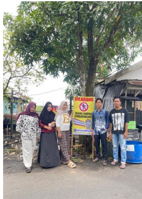
Dokumentasi: Senin, 28 Januari 2026