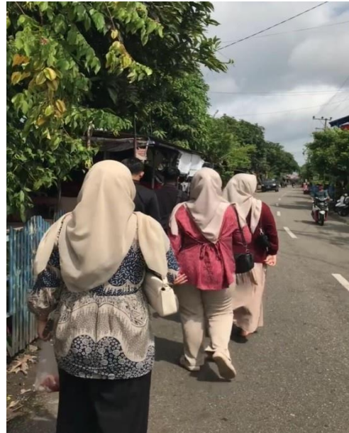
Dokumentasi: Rabu, 24 Desember 2025