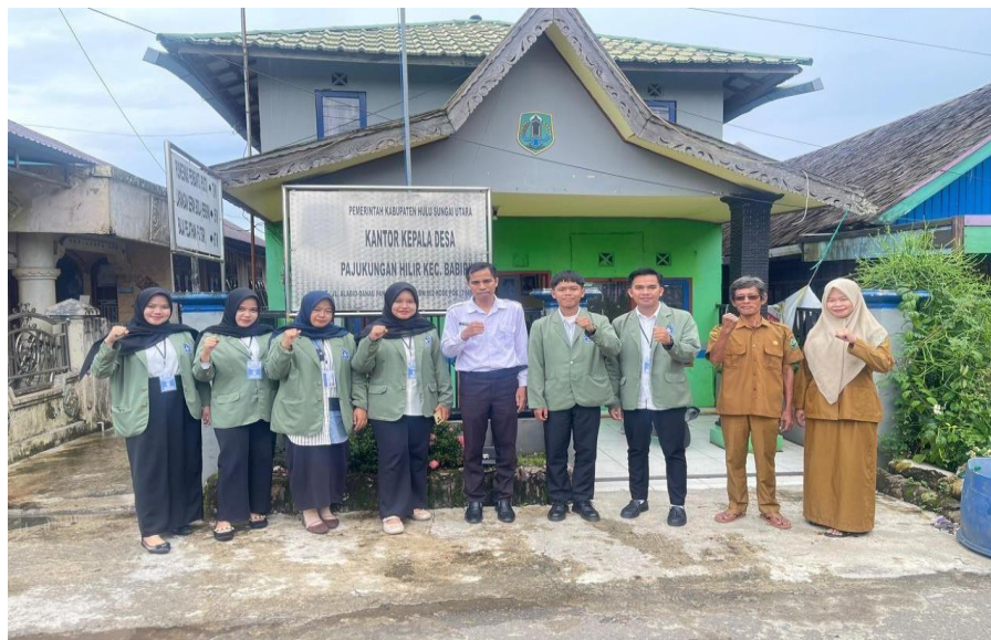
Dokumentasi: Selasa, 23 Desember 2025