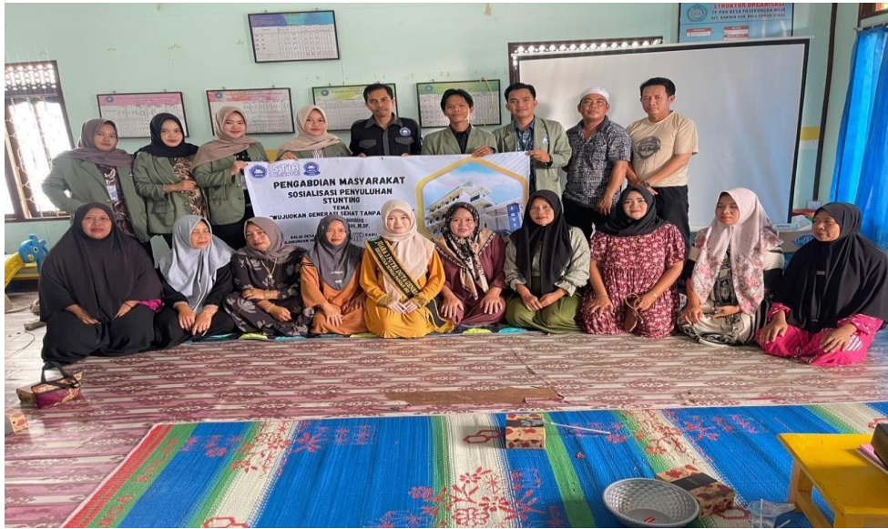
Dokumentasi: Rabu, 18 Februari 2026