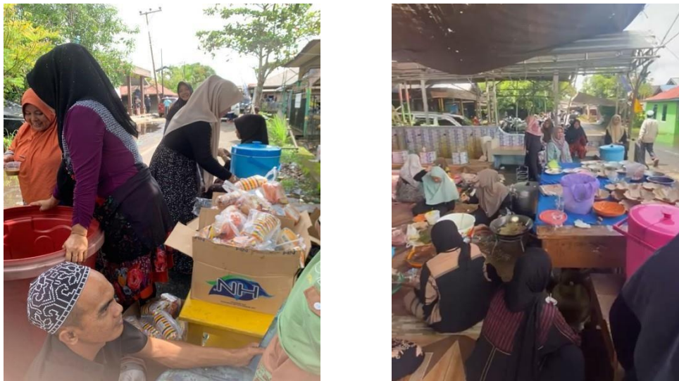
Dokumentasi: Senin, 12 Januari 2026