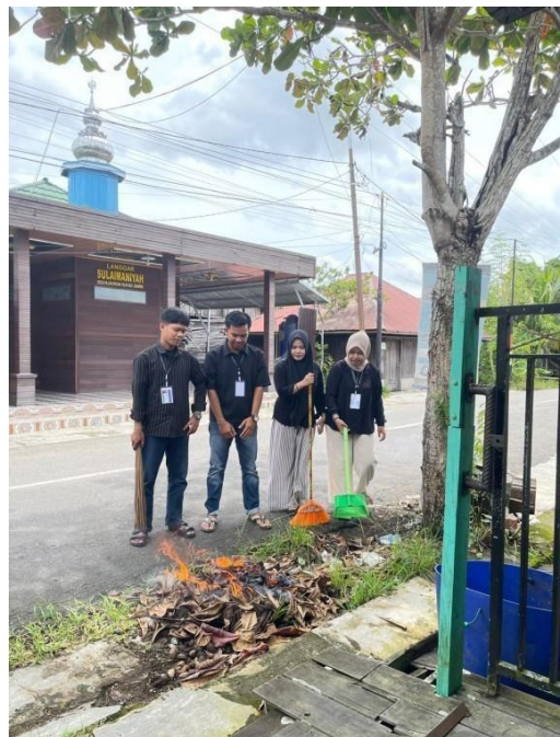
Dokumentasi: Selasa, 30 Desember 2025