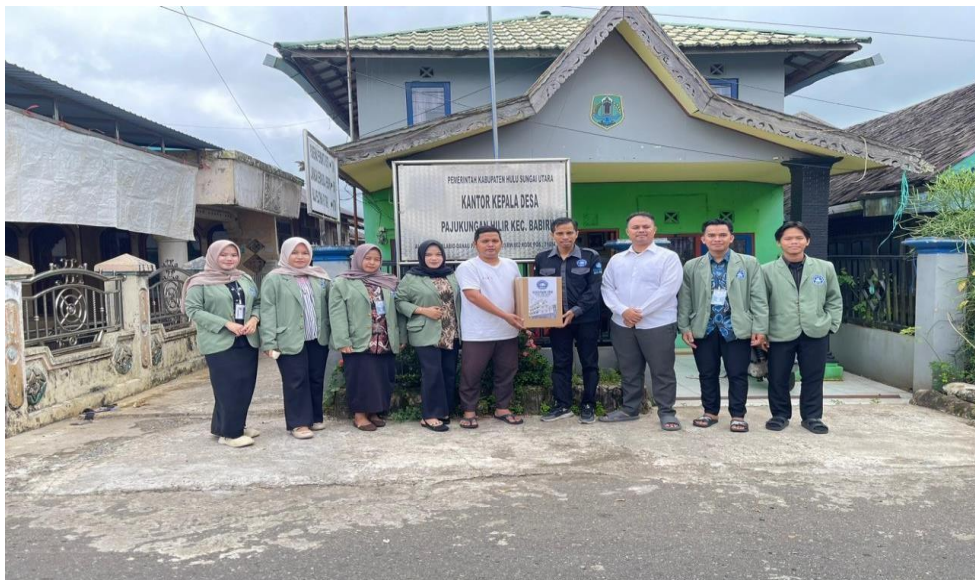
Dokumentasi: Rabu, 18 Februari 2026