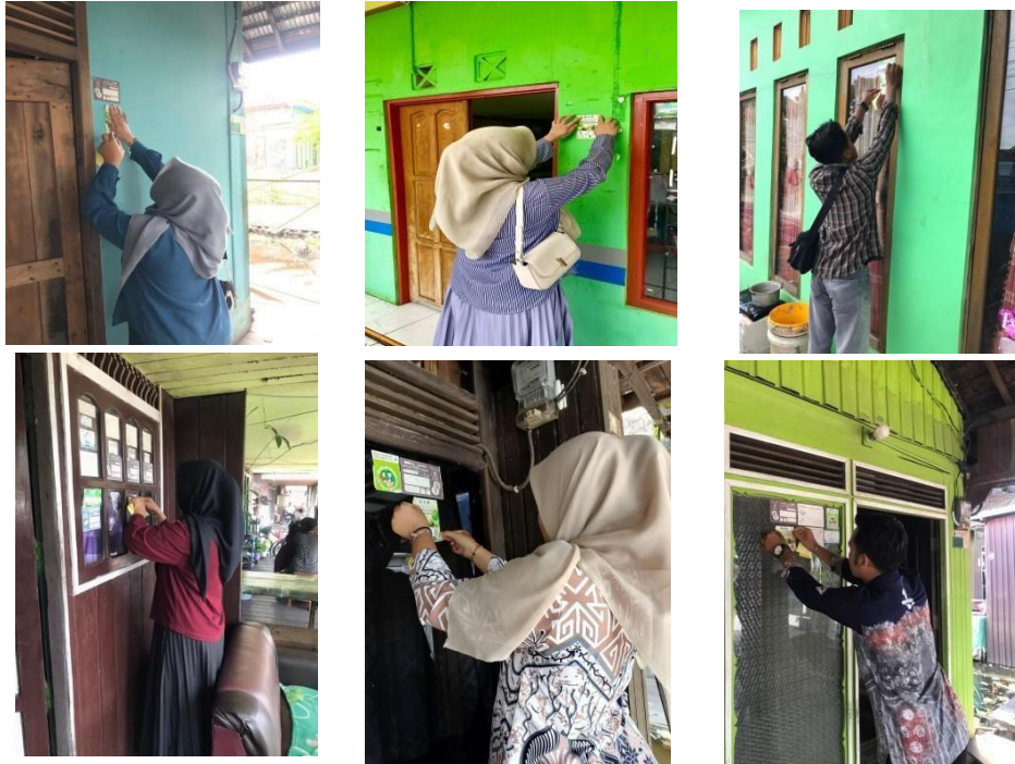
Dokumentasi: Jumat, 09 Januari 2026