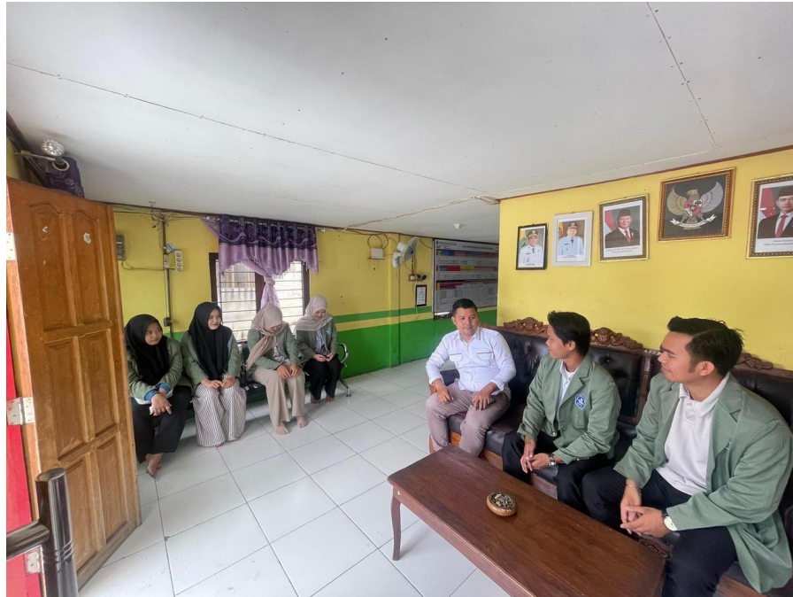
Dokumentasi: Rabu, 17 Desember 2025