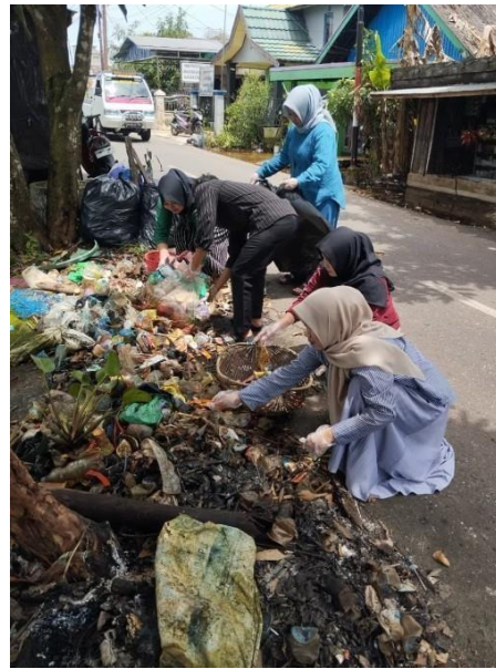
Dokumentasi: Selasa, 20 Januari 2026