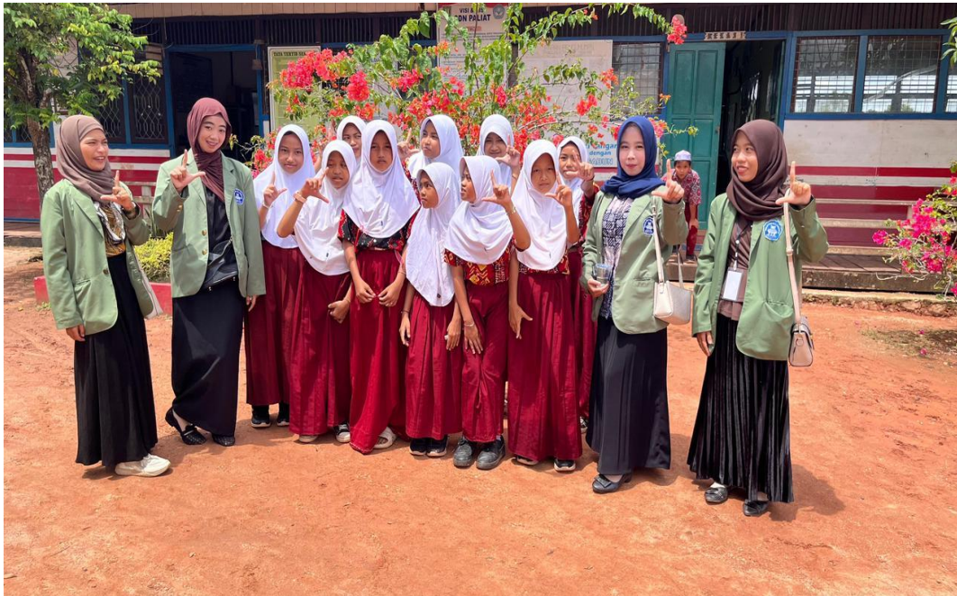
Foto Bersama Dengan Sebagian Anak-Anak Sd Paliat RT. 002

(Sumber: Dokumentasi Pribadi 5 Februari 2026)