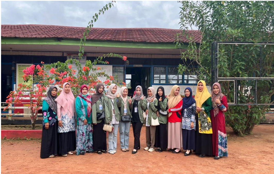
(Sumber: Dokumentasi Pribadi 13 Februari 2026)