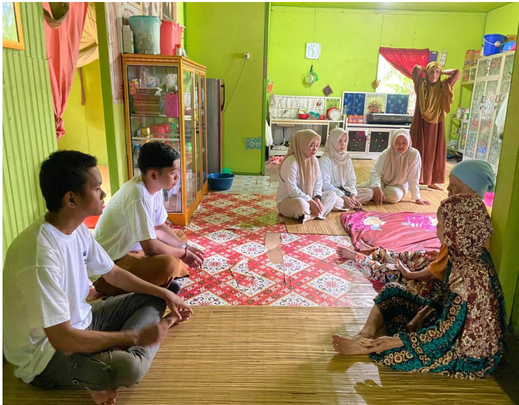
Gambar 7 Program Kerja Kunjungan Kasih ke rumah Lansia di Desa Kaludan Besar