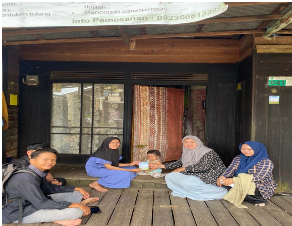
Gambar 9 Pembuatan stiker cegah stunting dan Sosialisasi kerumah anak yang terdaftar stunting di Desa Kaludan Besar