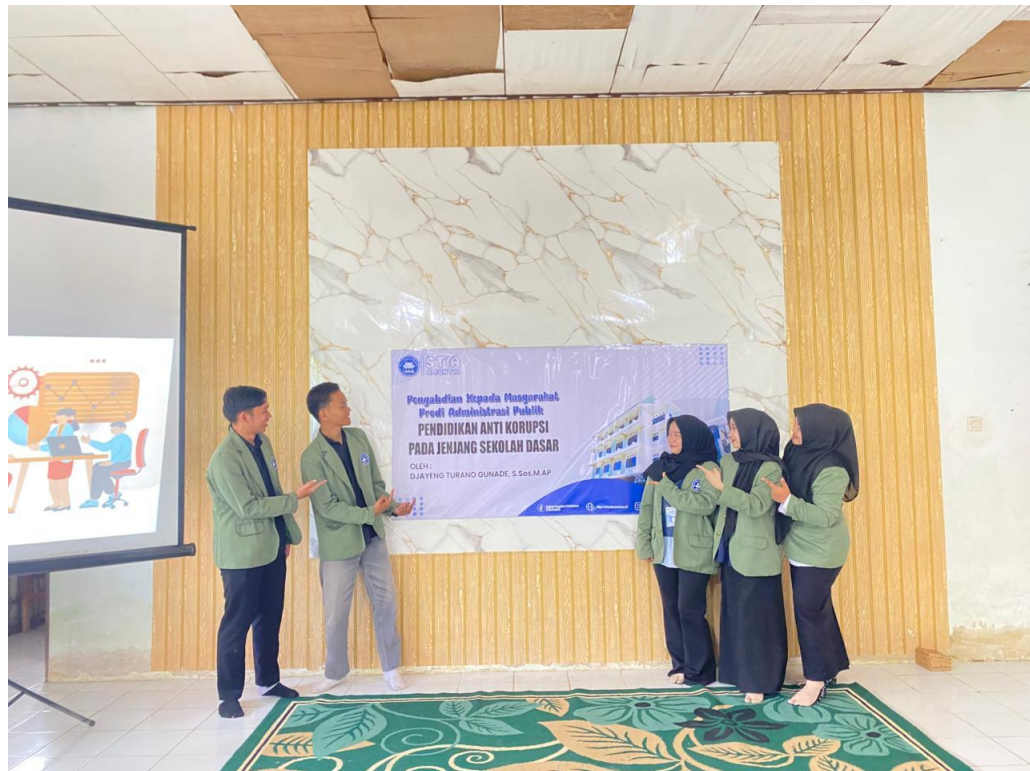
Gambar 5 Pengabdian kepada Masyarakat melalui Sosialisasi tentang Pendidikan Anti Narkoba Pada Jenjang Sekolah Dasar di SDN Kaludan Luar