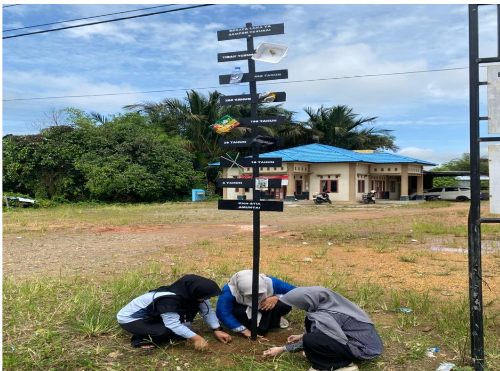
Gambar 8 Pembuatan Papan Edukasi Penguraian sampah dan di letakkan di depan kantor Desa Kaludan Besar