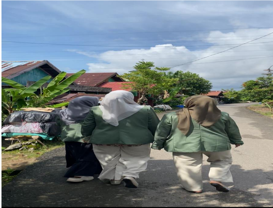
Gambar 3 Kegiatan Survei Lapangan di desa Kaludan Besar untuk Perencanaan Program Kerja