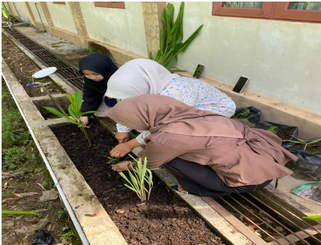
Gambar 6 Pembuatan pupuk kompos dari batang pisang dan penanaman rempah menggunakan pupuk kompos yang sudah di campur dengan tanah