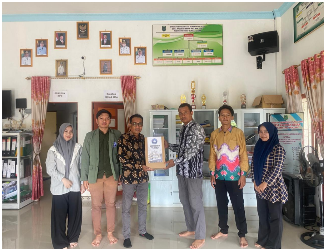
Gambar 15 Penjemputan Mahasiswa/i KKN di Desa Kaludan Besar oleh Dosen Pembimbing Lapangan