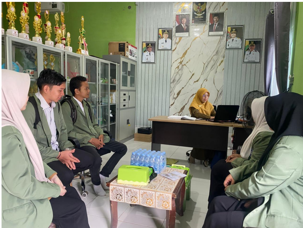
Gambar 4 Koordinasi dengan Kepala Sekolah SDN Kaludan Luar terkait Pelaksanaan Sosialisasi Pengabdian kepada Masyarakat