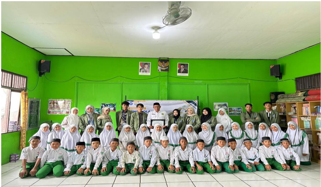
09 Februari 2026