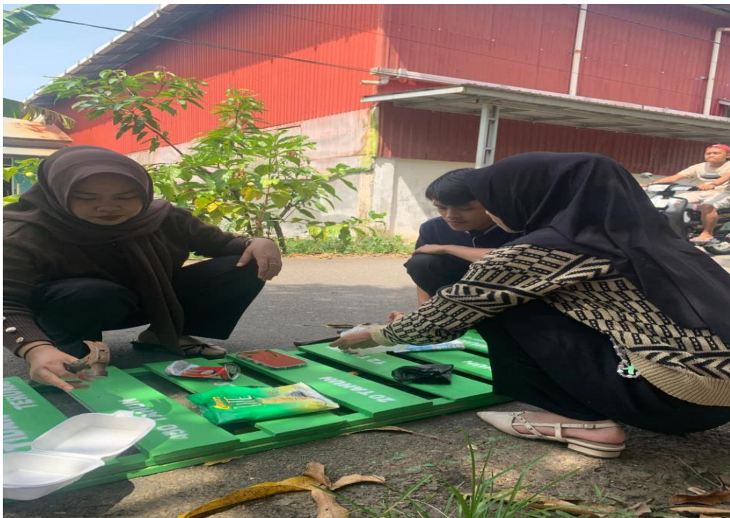
23 Januari 2026