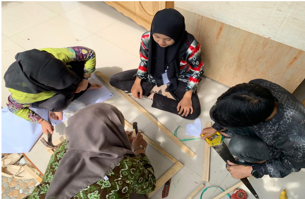
Gambar 7 Proses Pembuatan Spanduk Pencegahan Stunting