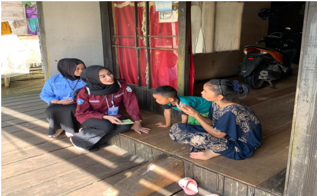
Gambar 9 Edukasi dan Pemasangan Stiker Pengelolaan Sampah