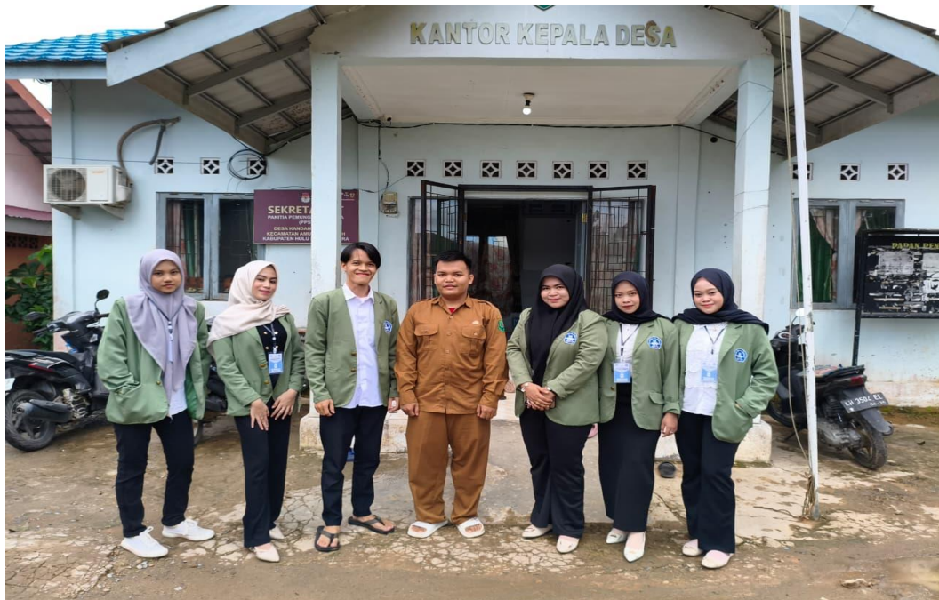
Gambar 1 Foto Bersama Pembina