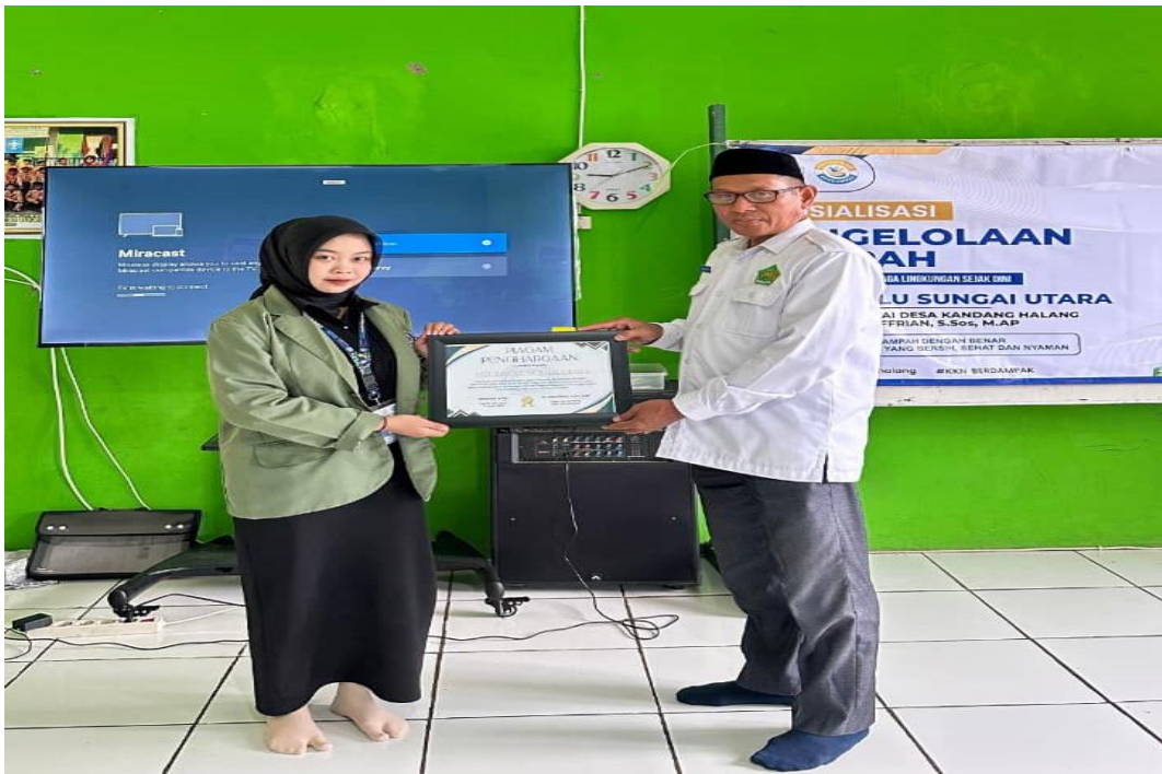
09 Februari 2026