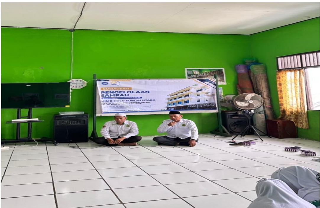
09 Februari 2026