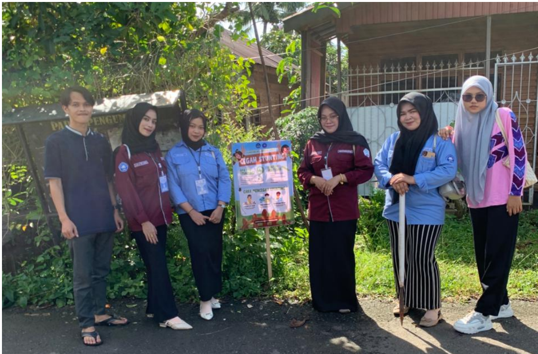
Gambar 8 Program Kerja Spanduk Pencegahan Stunting