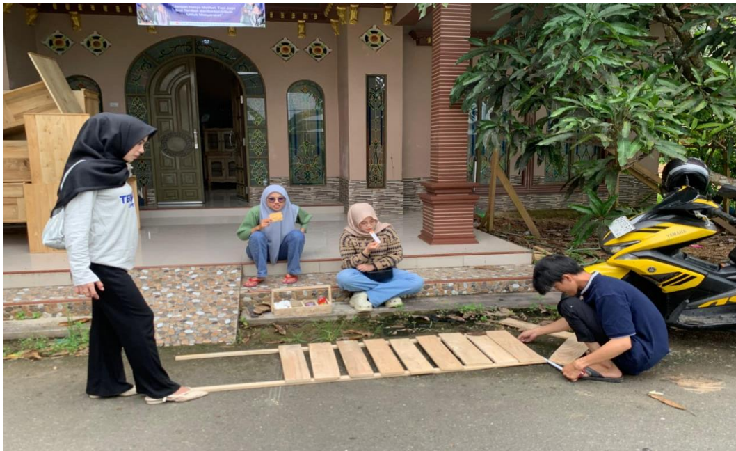
Gambar 10 Program Kerja Palang Edukasi Sampah