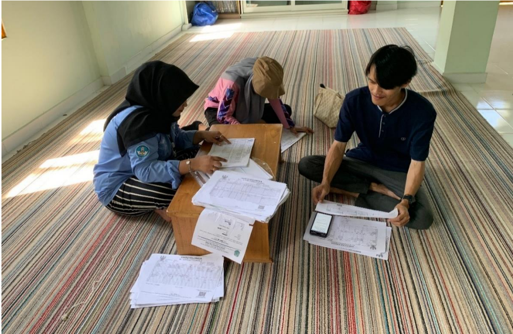
Gambar 3 Menginput Data Kartu Keluarga