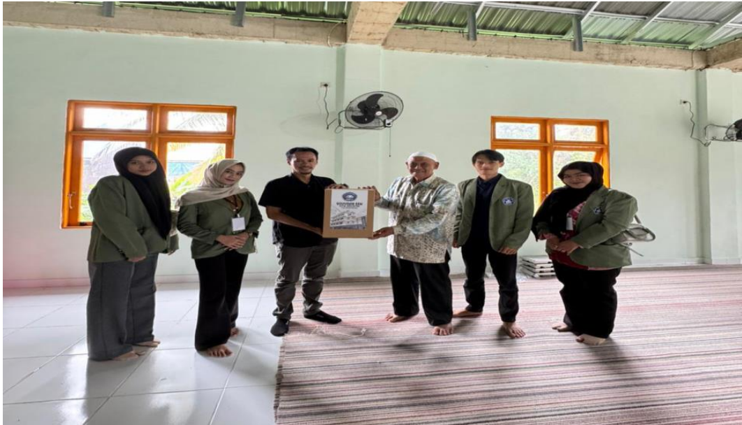
Gambar 14 Penjemputan Mahasiswa KKN oleh DPL