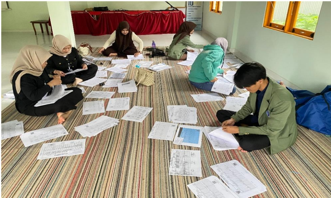
Gambar 5 Menyusun Data KK dan KTP