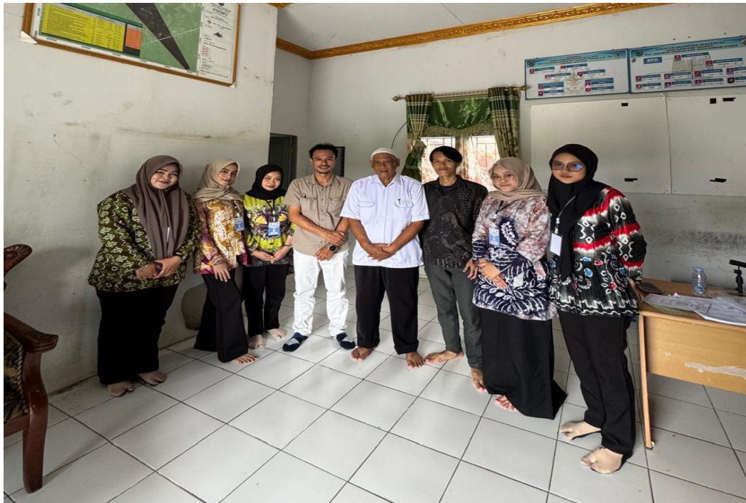
Gambar 2 Pengantaran Mahasiswa KKN oleh DPL