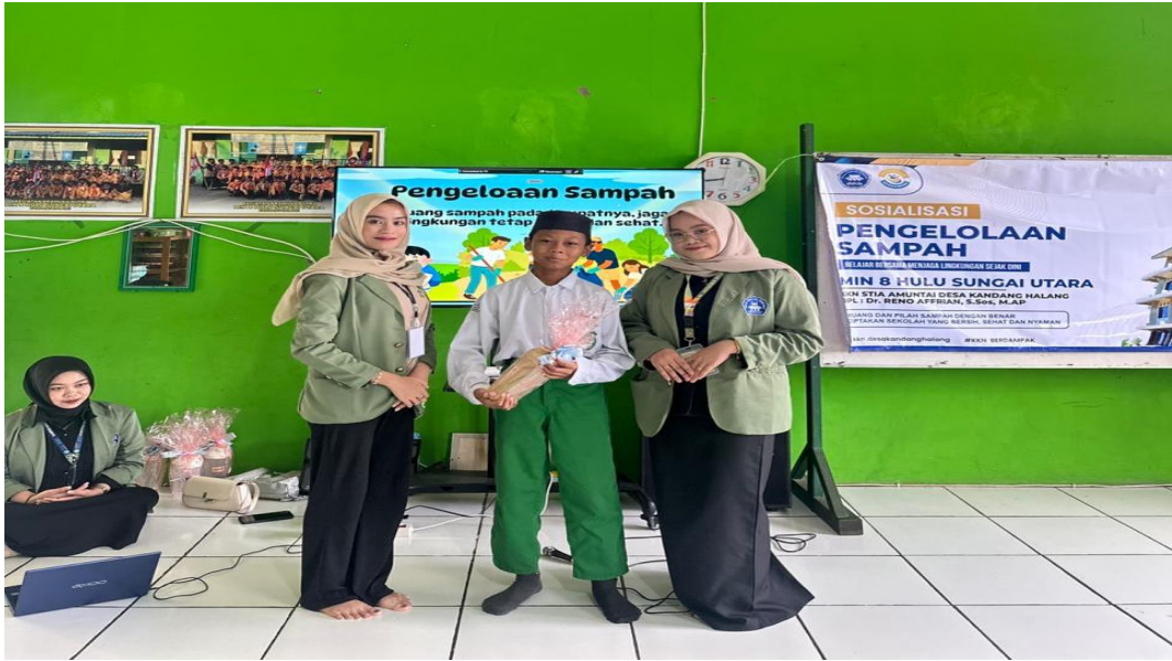
09 Februari 2026