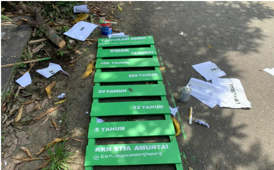
21 Januari 2026