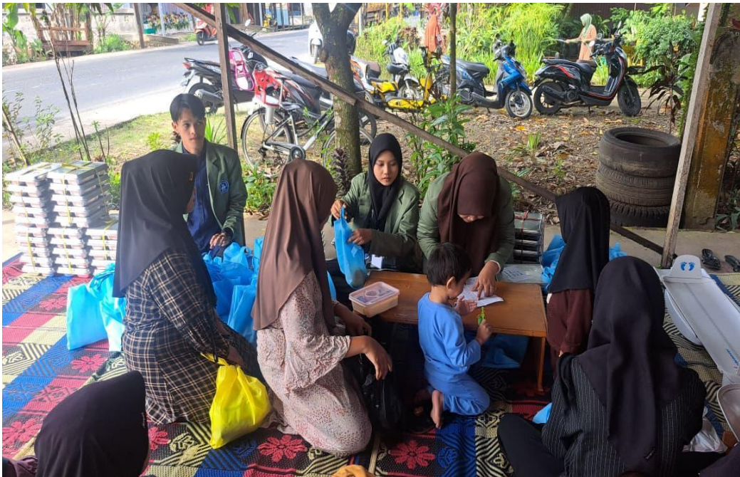
Gambar 11 Mengikuti Kegiatan Posyandu Bayi dan Balita