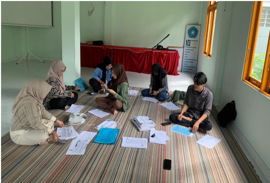
Gambar 4 Menginput Data Kartu Tanda Penduduk