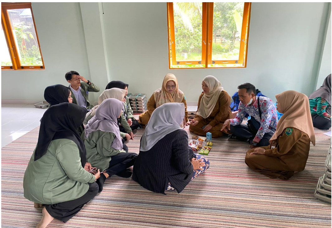
Gambar 6 Kegiatan Pembagian Makan Bergizi Gratis (Ibu hamil, Busui dan Balita)