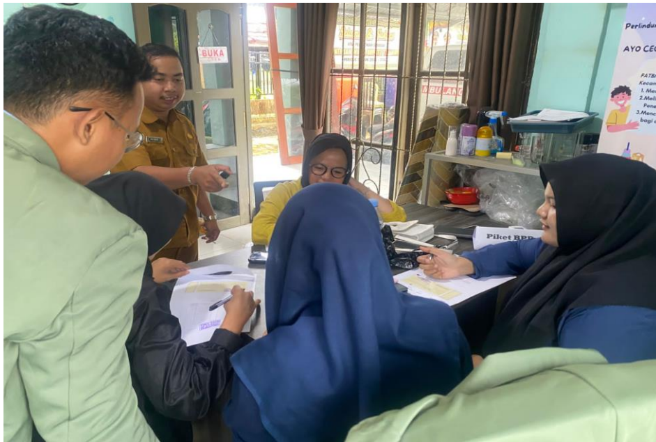
Sumber: Dokumentasi KKN Desa Banua Lawas, (05 Januari 2026)