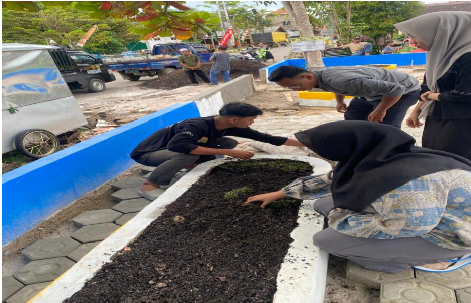
Gambar 3 Kontribusi dalam penanaman Tanaman di RTH