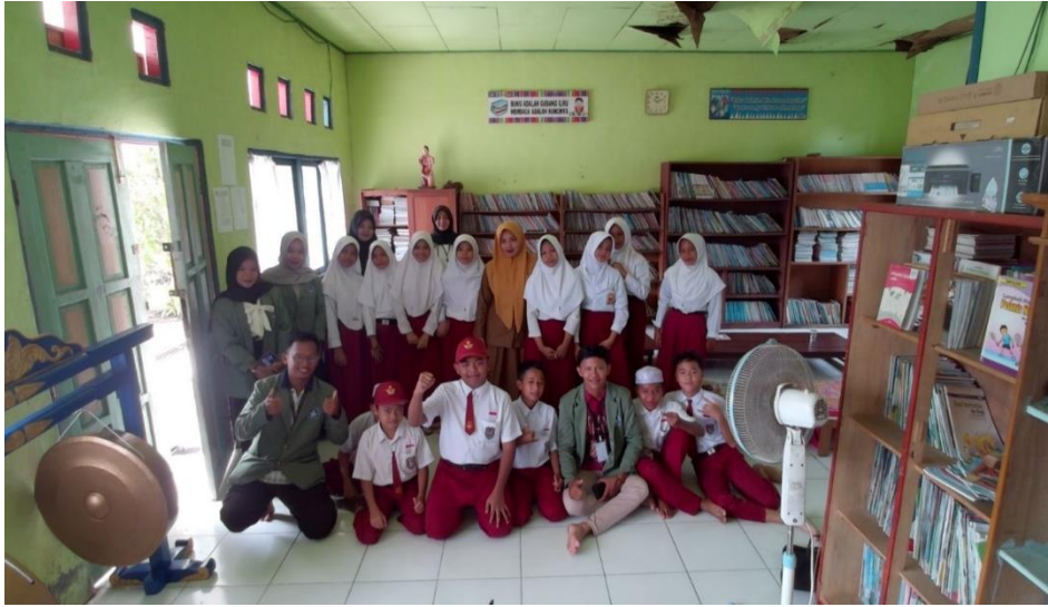
Sumber: Dokumentasi KKN Desa Banua Lawas, (12 Januari 2026)