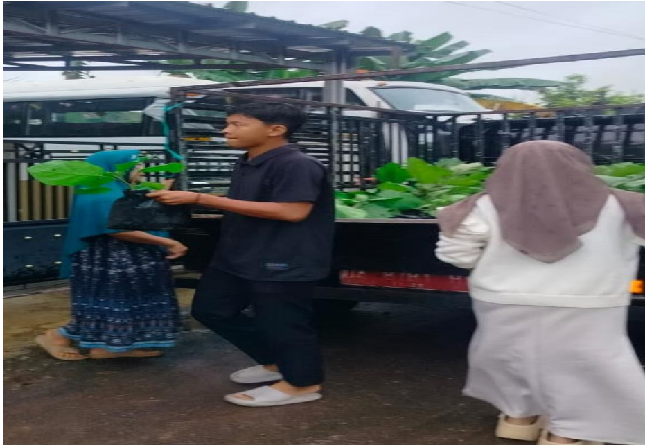
Gambar 13 Pembagian Bibit Tanaman Terong

Sumber: Dokumentasi KKN Banua Lawas, (10 Februari 2026)