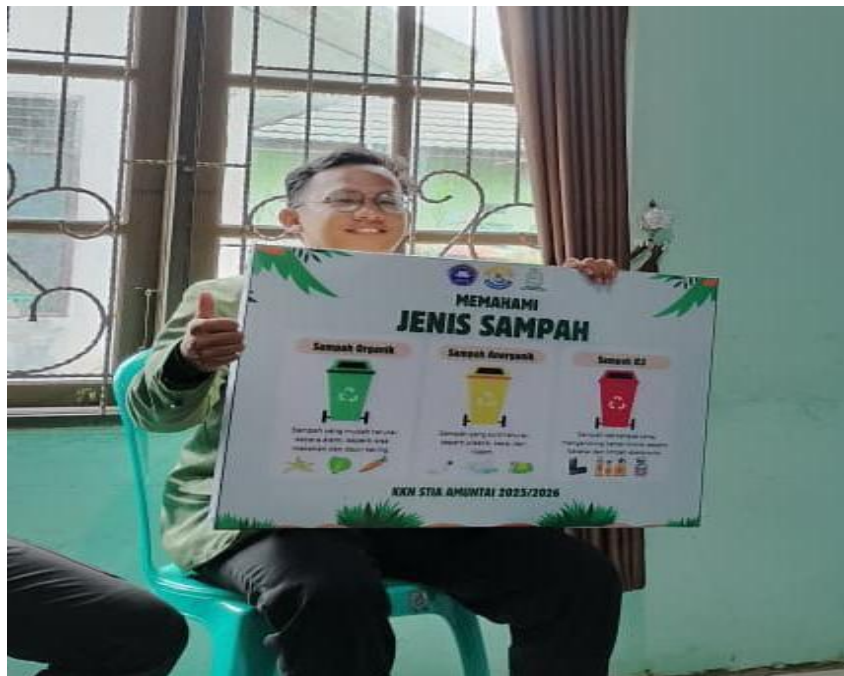
Gambar 14 Plang Edukasi Pemilahan Sampah