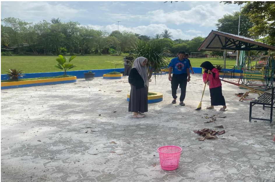
Gambar 10 Kegiatan Bersih-bersih

Sumber: Dokumentasi KKN Desa Banua Lawas, (30 Januari 2026)