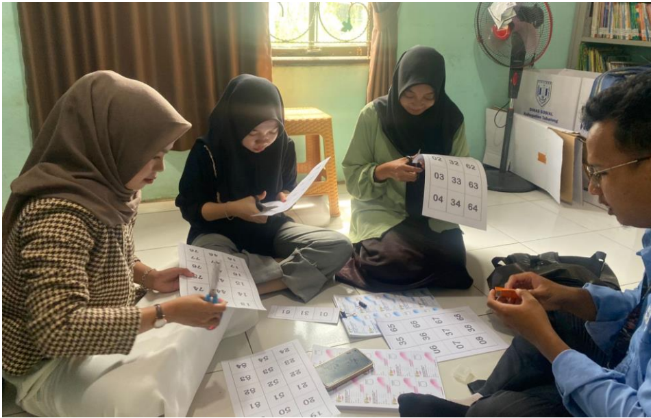
Gambar 9 Kegiatan Pengguntingan Kartu Kunjungan Posyandu 6 SPM