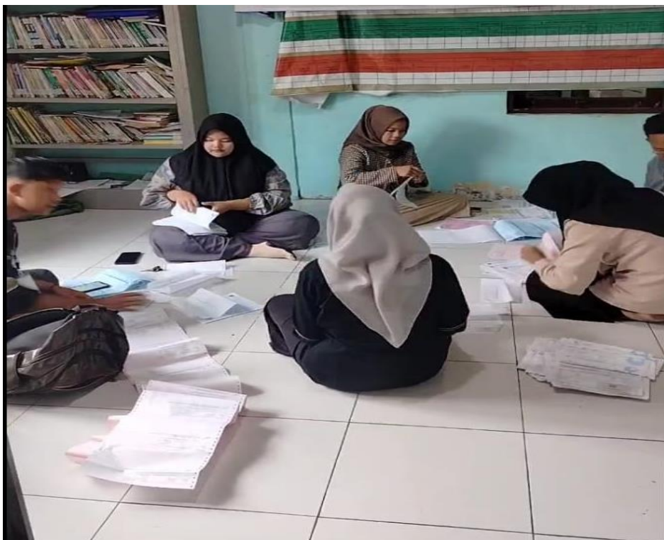
Gambar 4 Kegiatan Penyusunan SPT PBB denagn Struk Pembayaran

Sumber: Dokumentasi KKN Desa Banua Lawas, (24 Desember 2025)