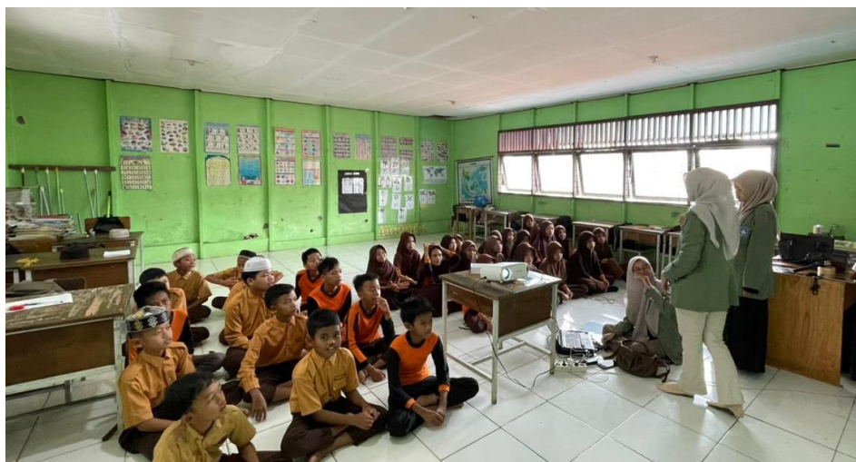
Pengabdian Masyarakat pada Sekolah SD Negeri Panyuran 2