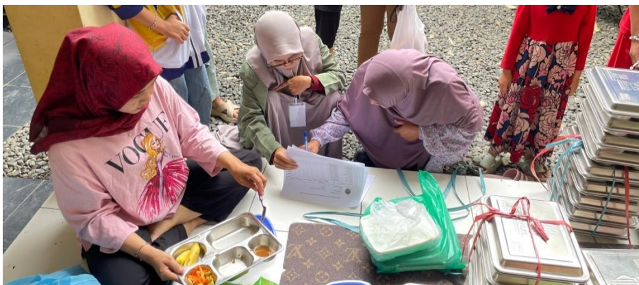
Membantu Kader Posyandu dalam Pembagian MBG