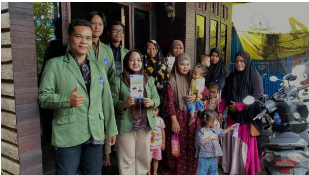
Foto Bersama Masyarakat Desa RT. 04 setelah Pelaksanaan Sosialisasi Stunting