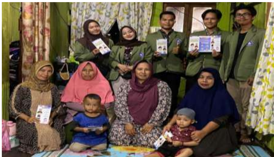
Gambar 4. 4 Sosialisasi dan Edukasi Stunting di RT. 02

Berdasarkan permasalahan tersebut, kami menginisiasi program kerja “Pencegahan Stunting di Desa Pandamaan” melalui kegiatan sosialisasi, edukasi gizi, penyuluhan pola asuh, serta kampanye pentingnya 1.000 HPK. Program ini diharapkan mampu meningkatkan pemahaman masyarakat, mendorong perubahan perilaku yang lebih sehat, serta mendukung upaya pemerintah desa dalam menekan angka stunting secara berkelanjutan.