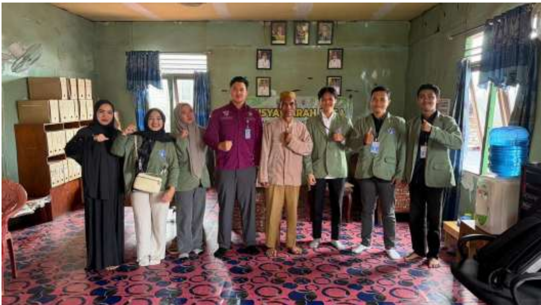
Pengantaran Mahasiswa KKN