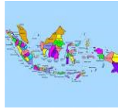
( Indonesia )

Tata surya merupakan sekumpulan planet-planet berputar mengikuti porosnya, jika tata surya disebut sebagai sebuah sistem, maka sub sistemnya adalah planet bumi, karena planet bumi merupakan bagian dari tata surya, seterusnya jikalau kita mengatakan planet bumi itu adalah sebuah sistem, maka sub sistemnya adalah negara Indonesia, karena negara Indonesia merupakan bagian dari planet bumi, begitu juga jikalau kita mengatakan bahwa Indonesia sebuah sistem, maka sub sistemnya adalah kota