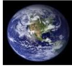
( Planet Bumi )