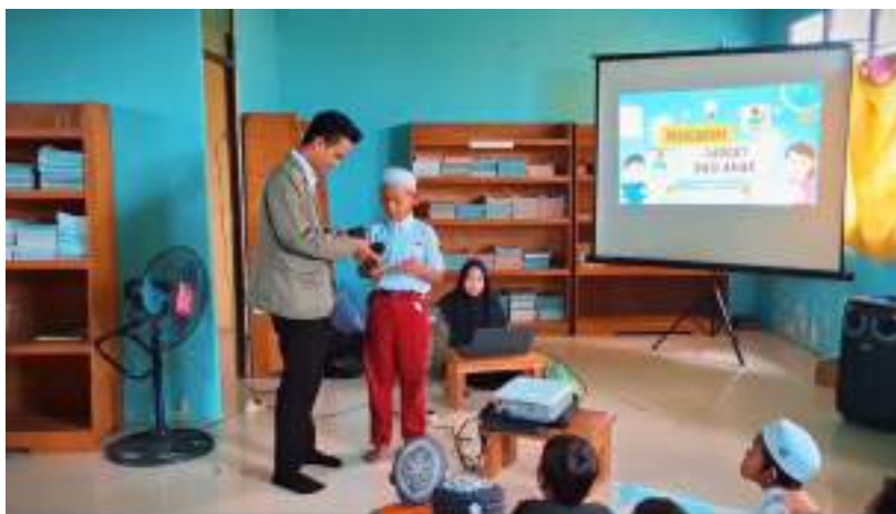
Gambar 2 : Pembagian hadiah bagi siswa yang bertanya

Setiap penanya diberikan hadiah menarik dari pelaksana kegiatan pengabdian kepada masyarakat (PKM).