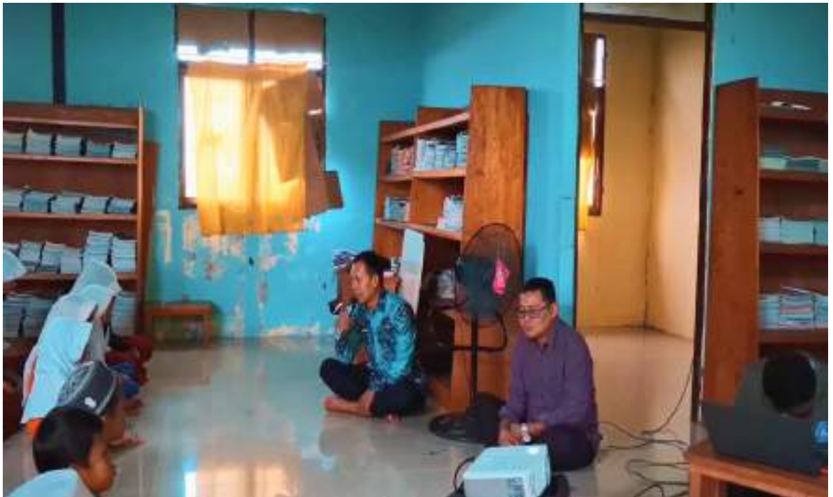
Gambar 1 : Sambutan Kepala Sekolah dan Ketua Tim

Juga dalam kesempatan ini juga di berikan bimbingan kepada anak siswa bagaimana cara penggunaan gadget dengan baik dan bijak. Pada bagian ini pula anak disuruh menampilkan fitur atau sarana serta aplikasi yang sering dipakai anak dalam pemakaian gadget sehari – hari. Kemudian anak diberikan informasi melalui video tentang pemakaian gadget yang baik dan bijak serta dampak dari pemakaian gadget melebihi batas waktu.