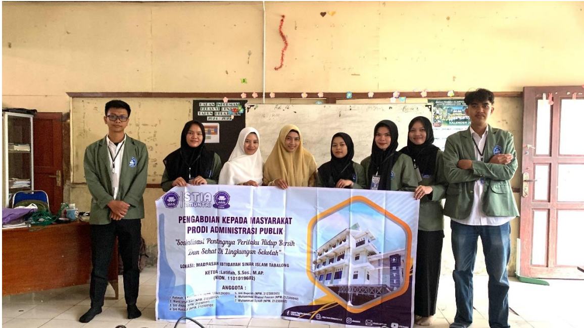
Foto – Foto Kegiatan Pengabdian Kepada Masyarakat dengan Tema Sosialisasi Pentingnya Hidup Bersih Dan Sehat Di Lingkungan Sekolah