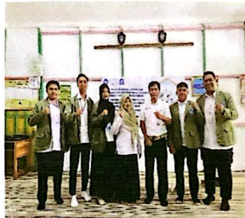
Foto Bersama dengan DPL, Kepala Sekolah, serta Mahasiswa PKL