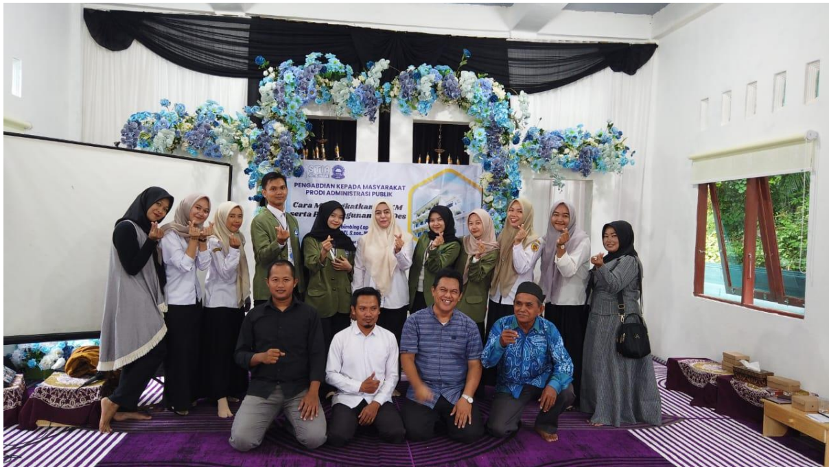
GAMBAR 1.5