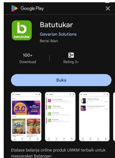
Gambar 2. 2 Tampilan Aplikasi di Playstore